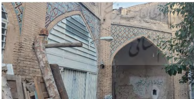
شکل ۲- قصر جمیلان محله سنبلستان، شهر اصفهان

شناسایی شده مختص شهر اصفهان هستند و قابل تعمیم‌پذیری نیست. بدیهی است موضوع کلی تحقیق و بهره‌گیری از ادبیات عامه و اساطیر و تورهای گردشگری ادبی محدود به یک جامعه خاص نیستند.