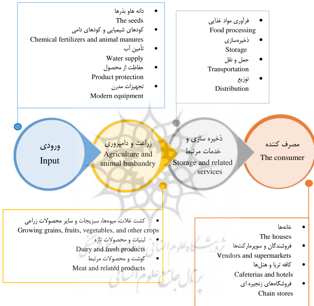
شکل ۱- تأثیرات همه‌گیری کووید-۱۹ بر سیستم‌های کشاورزی (Sridhar et al. , 2022)

سیاست‌های فاصله‌گذاری اجتماعی و قرنطینه مدنی برای جلوگیری از گسترش ویروس روی آورده‌اند. تأثیر بازداشتن افراد از توانایی کار و فعالیت، ملاقات و معاشرت به شدت به فعالیت‌های اقتصادی، به‌ویژه در بخش خدمات و کشاورزی آسیب وارد کرده است (Barichello, 2020). کشاورزی به‌عنوان بخش مهمی از اقتصاد جهان شناخته شده که عمدتاً در کشورهای در حال توسعه، نقش حیاتی دارد و نیازهای اصلی