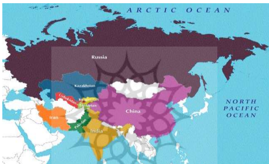
نقشه ۱- اعضای سازمان همکاری شانگهای

زیرا تقویت صادرات بخش کشاورزی، بهبود اشتغال و کاهش فقر روستایی، ارزآوری، کاهش وابستگی به درآمد نفتی، رشد اقتصادی و ثبات بازارهای هدف را به همراه دارد. بر این اساس، ضرورت دارد که عوامل مؤثر بر صادرات کشاورزی ایران با کشورهای درون یک موافقت‌نامه بررسی شود و بدین پرسش پاسخ داده شود که «ایران چه مقدار از ظرفیت‌های بازارهای هدف خود بهره برده است؟».