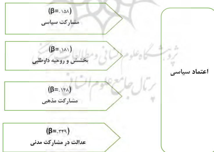
تصویر ۱. مدل تجربی تحقیق (در چارچوب فرضیه چندمتغیری تحقیق)

باتوجه به نتایج آزمون فرضیه چندمتغیره، مدل تحقیق به شرح زیر ترسیم می‌گردد: