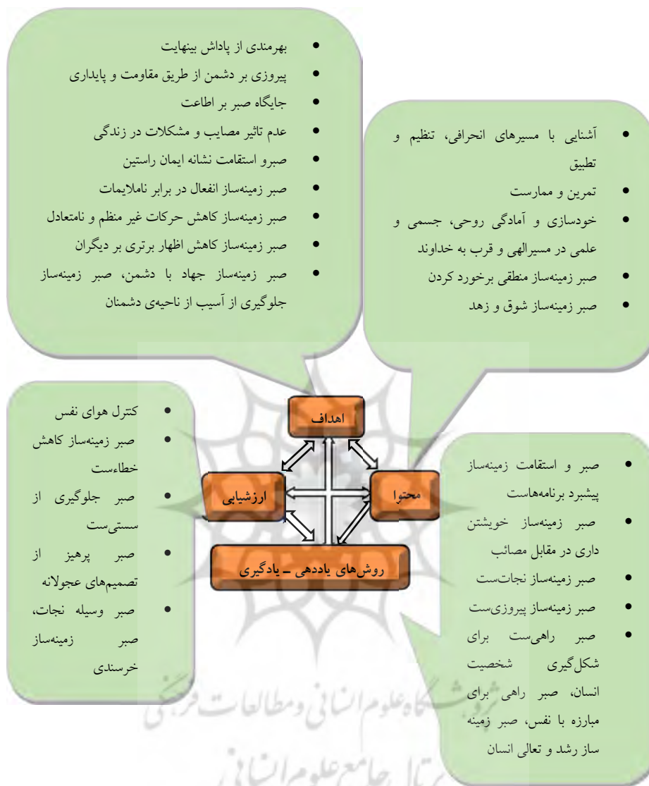
نمودار ۱. الگوی برنامه درسی مبتنی بر صبر بر اساس آموزه‌های اسلامی

آخرین گام در پژوهش حاضر، اعتبار سنجی الگوی است. داده‌ها از طریق پرسشنامه با طیف لیکرت (خیلی زیاد، زیاد متوسط، کم و خیلی کم)، تدوین و در اختیار ۳۸۴ نفر از متخصصان قرار داده شد و در نهایت ۳۶۱ پرسشنامه ارجاع شد و داده‌های جمع‌آوری شده مورد تحلیل قرار گرفتند. لذا برای اعتبارسنجی مدل از مدل معادلات ساختاری استفاده شد. در