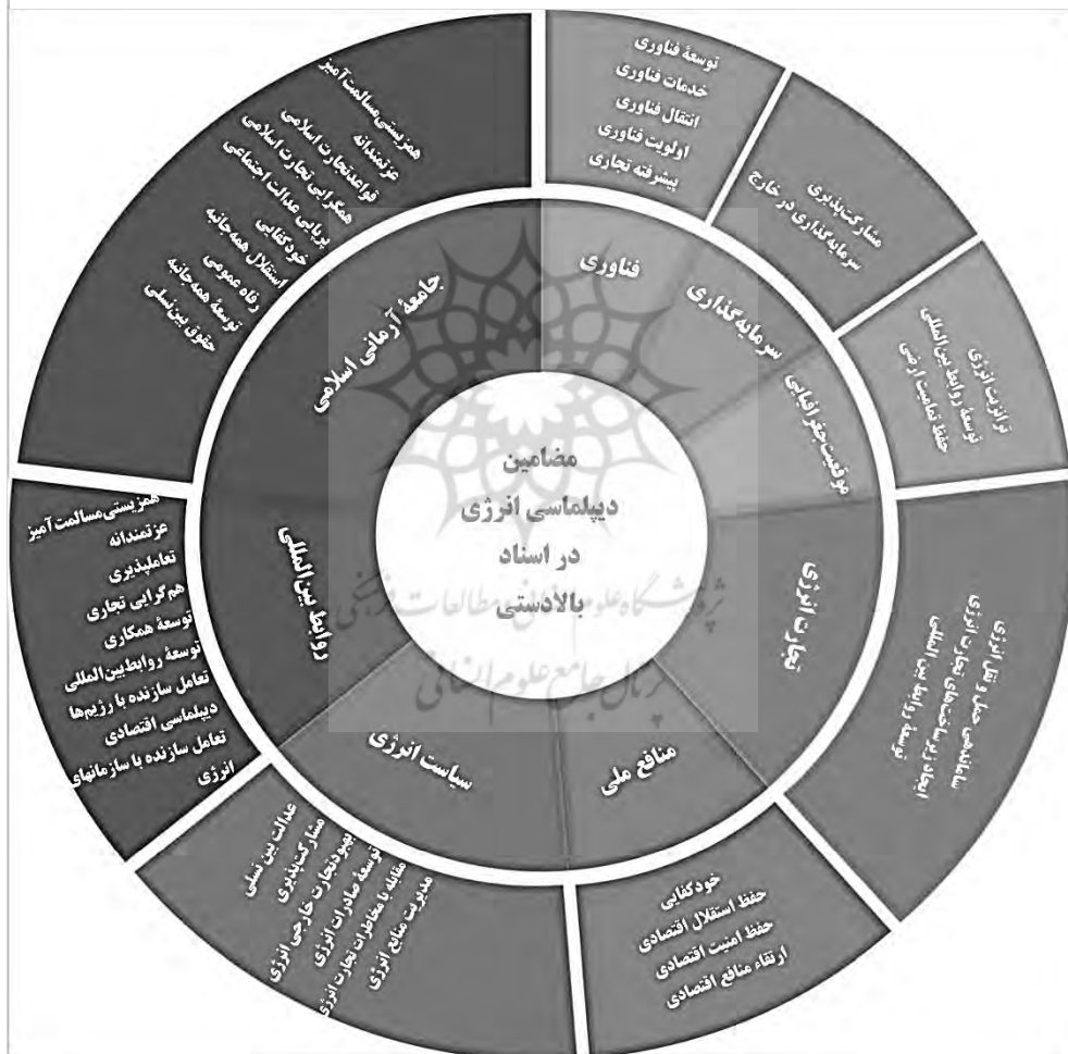
شکل ۱: الگوی دیپلماسی انرژی جمهوری اسلامی ایران

نگاه جامع و منظومه‌ای به شبکهٔ مضامین و محتوای سیاستی موجود در اسناد بالادستی مورد بررسی، شمای دیپلماسی انرژی در نظر سیاست‌گذار جمهوری اسلامی ایران را نشان می‌دهد؛ این تصویر کلی از الگوی دیپلماسی انرژی جمهوری اسلامی ایران در شکل (۱) نمایش داده شده است.