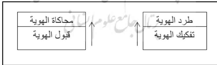
الرسم (٣): استراتيجية تعاملية للأنا والآخر