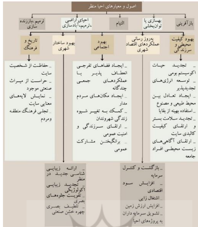
شکل ۲. اصول و معیارهای احیا منظر و اثرات مثبت احیا. ماخذ: نگارندگان براساس منابع پژوهش

اهداف بازسازی اراضی پسا صنعتی، به عنوان بخشی از نوسازی شهری، ناگزیر با ایده‌هایی همچون استوارسازی و بهینه سازی عملکرد شهری، بهبود ساختار شهری و ترویج تمدن شهری هدایت می‌شود [۲۱]. که در نهایت موجب تغییر در سیمای شهر