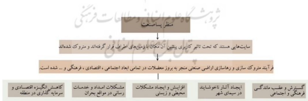
شکل ۱. اثرات منفی متروک سازی عرصه‌های پسا صنعت. ماخذ: نگارندگان براساس منابع پژوهش

– مولفه‌های احیای منظر پسا صنعتی به منظور افزایش پویایی و سرزندگی چیست؟ – از طریق چه راهکارهای طراحی شهری می‌توان سرزندگی و پویایی را به سایت پسا صنعت کارخانه پارس الکتریک شهر رشت بازگرداند؟