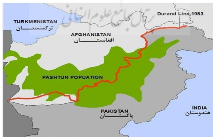
شکل ۲: مرز دیورند: جدایی قوم پشتون

اقلیت‌های مختلف درون کشور ممکن است برای خود هویت مستقل قائل باشند و دست به اقدامات جدایی طلبانه بزنند و دارای آرمان سیاسی باشند. این مسئله باعث تنش درون کشور می‌شود. از این اتفاقات نیز در بسیاری از کشورها و مناطق جهان مشاهده می‌شود. مانند جنبش‌های جدایی خواهی اهالی کبک در کانادا، اسکاتلندی‌ها در بریتانیا، کاتالون‌ها با سکیها در اسپانیا، کردها در عراق و مسلمانان چین در روسیه جز مهم‌ترین‌ها هستند. وقتی نیروهای خارجی به صورت مداخله جویانه و حامی نیروهای اقلیت باشند، مسئله بعد بین المللی پیدا می‌کند [۴]. خط