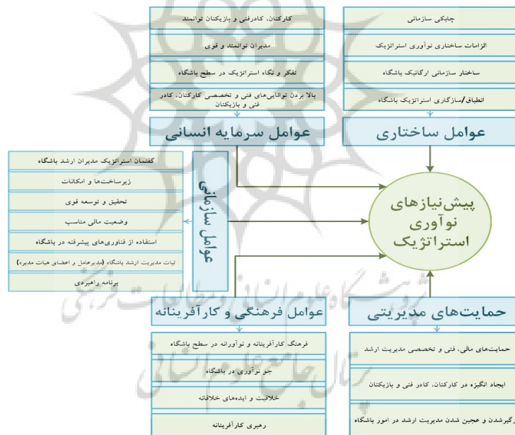
شکل ۲. مدل نهایی تحقیق

همانطور که بیان شد، در نهایت نتایج حاصله در پیش‌نیازهای نوآوری استراتژیک در صنعت فوتبال پنج مقوله شناسایی گردید که در شکل زیر مدل نهایی تحقیق شامل پیش‌نیازهای نوآوری استراتژیک و مقوله‌ها و مفاهیم مربوطه نشان داده شده است: در ادامه مدل نهایی پژوهش نشان داده شده است: