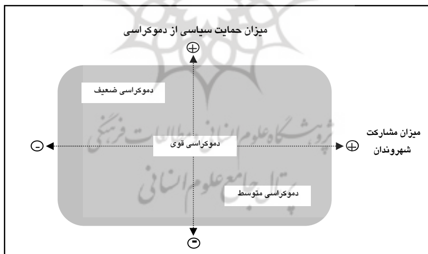
نمودار ۱ انواع دموکراسی (Mahrer and Krimmer, ۲۰۰۵)