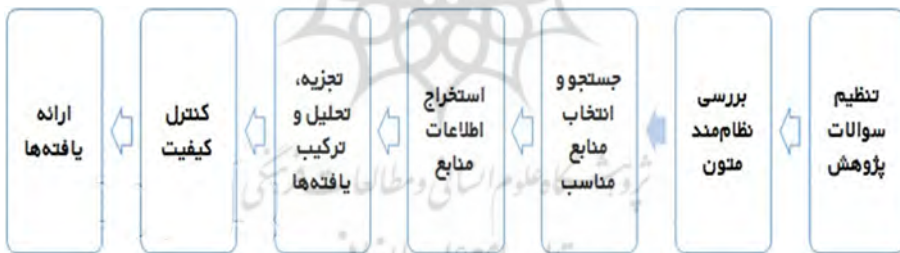
شکل ۱. روش فراترکیب هفت مرحله‌ای سندلوسکی و باروسو (۲۰۰۷)

روش‌های متعددی برای انجام فراترکیب پیشنهاد شده‌است که الگوی هفت مرحله‌ای سندلوسکی و باروسو بیشترین کاربرد را دارد که شامل موارد زیر است: ۱. تنظیم سؤال پژوهش؛ ۲. مرور ادبیات به‌صورت نظام‌مند؛ ۳. جست‌وجو و انتخاب متون مناسب؛ ۴. استخراج اطلاعات متون؛ ۵. تجزیه و تحلیل و ترکیب یافته‌های کیفی؛ ۶. کنترل کیفیت؛ ۷. ارائه یافته‌ها. این هفت مرحله در شکل ۱ ارائه شده‌است.