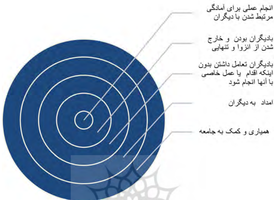
نمودار ۱. مراحل مشارکت مردمی از آمادگی تا همیاری (M. Levasseur et al, 2010: 2146)

از این‌رو، مشارکت از سطح فردی - یعنی آمادگی روحی و گرایشی و اقدامات فیزیکی ابتدایی - شروع می‌شود و با پیوستن به جمع و همراهی با جمع در فعالیت‌های مشخص ادامه یافته و با همیاری مردمی، تعمیق و گسترش می‌یابد. علاوه‌براینکه، با توسل به این مراحل می‌توان افراد یا اجتماعات را از حیث گرایش به مشارکت در امور جمعی طبقه‌بندی و گونه‌شناسی کرد، از نظر نوع عمل مشارکتی نیز می‌توان وضعیت افراد و اجتماعات را مشخص کرد. در اینجا مشارکت در مرحله‌ای از "مشارکت در ارائه اطلاعات" به‌عنوان نخستین مرحله آغاز شده و پس از آن، در "ارتباطات"، "مشاوره"، "همیاری" و "سرانجام، تا "کنترل" پیش می‌رود. انتظار رفتار مشارکت‌جویانه شهروندان و جوامع در هر دو الگوی مشارکتی از بالا و از پایین، در سطح اول بیشتر است و هرچه به سطوح گسترده و عمیق‌تر آن ارتقا می‌یابد، انتظار کمتر می‌شود. در اینجا مشارکت تابع قانون قدرت است؛ به این