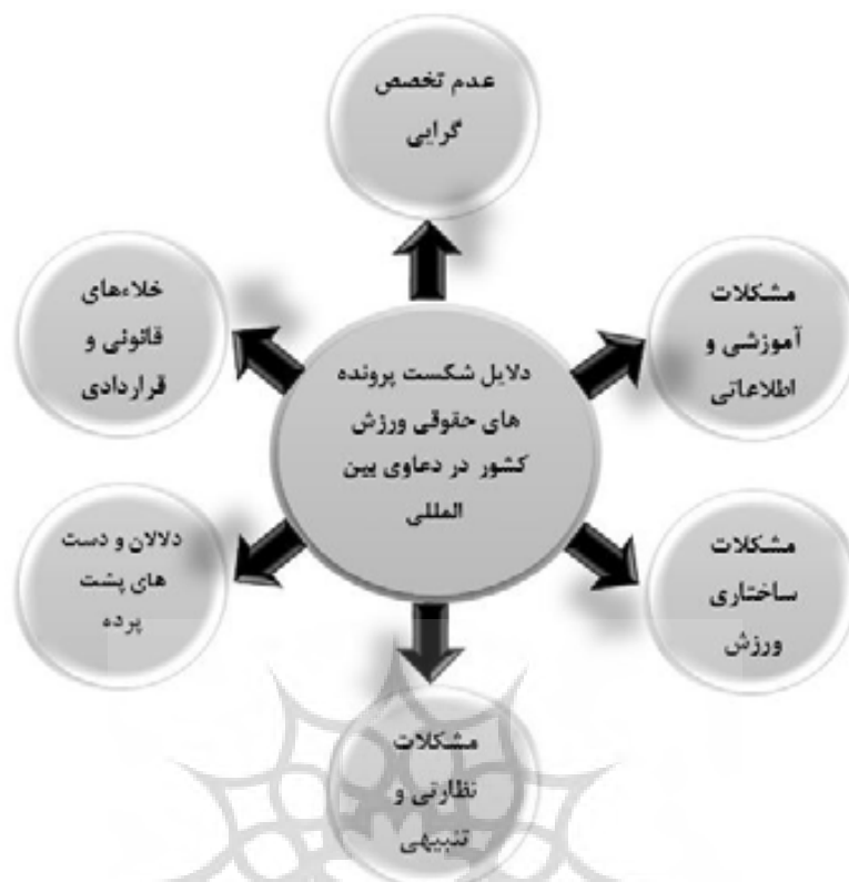
شکل ۳: الگوهای ذهنی شناسایی شده