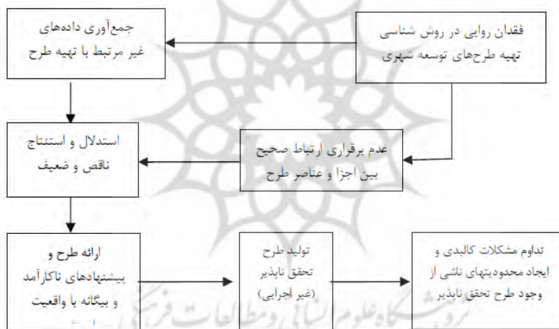
شکل ۳. پیامدهای فقدان روایی در روش‌شناسی تهیه طرح‌های توسعه شهری در ایران

کاستی‌های اساسی در روش‌شناسی تهیه طرح‌های توسعه شهری در ایران بررسی کاستی‌ها در روش‌شناسی طرح‌های توسعه شهری در دو عنوان قابل بررسی است: اول؛ کاستی‌های مربوط به فقدان روایی و دوم؛ کاستی‌های