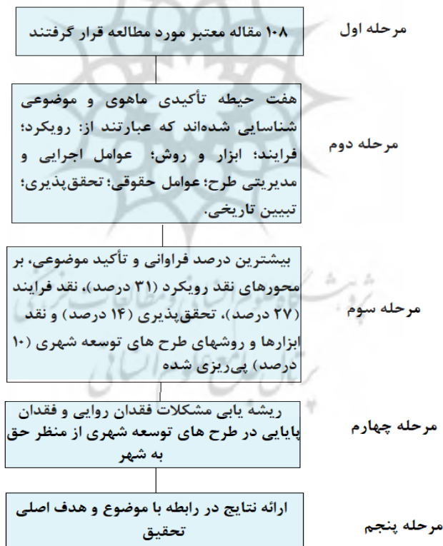
شکل ۲. مدل عملیاتی تحقیق

شناخت از مجموعه منسجم یا غیرمنسجم از مبانی علمی و سازه‌های پژوهشی. توانایی ارائه جواب به هنگام کم بودن حجم نمونه و سادگی در کسب آگاهی از متغیرها و روابط فی‌مابین، اهمیت این ابزار تحقیق را افزایش داده است. منابع منتخب مورد پژوهش در این زمینه در سه دسته کتب و پایان‌نامه، مقالات علمی-پژوهشی و مقالات غیر علمی-پژوهشی (اعم از علمی-