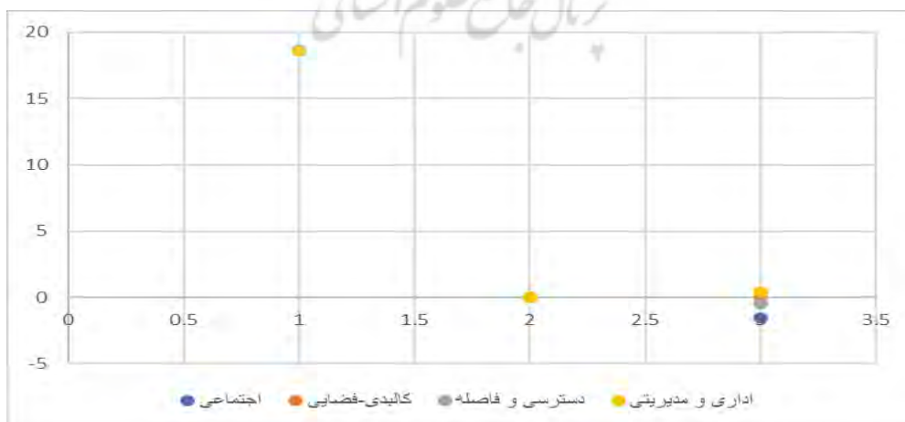
شکل ۴. نمودار تأثیر و تعامل عوامل مؤثر بر گرانی مسکن در شهر آباد در تکنیک DEMATEL

همان‌طور که در (جدول ۸) مشاهده می‌شود، از میان شاخص‌های مؤثر بر گرانی مسکن در شهر آباد، معیار اقتصادی و مالی با مقدار ۱۸/۶۵۵ بیشترین تعامل و معیار کالبدی-فضایی با مقدار ۱۸/۵۸۹ کمترین تعامل، معیار اقتصادی و مالی با مقدار ۱/۵۳۹ مؤثرترین عامل و معیار اجتماعی با مقدار -۱/۵۴۱ تأثیرپذیرترین عامل هستند. شکل (۴) چگونگی میزان تأثیر و تعامل معیارهای مؤثر بر گرانی مسکن در شهر آباد را نشان می‌دهد.