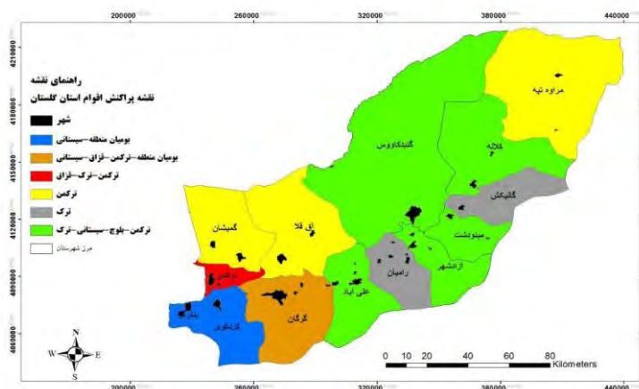
شکل ۲. پراکندگی اقوام در نواحی مختلف استان گلستان