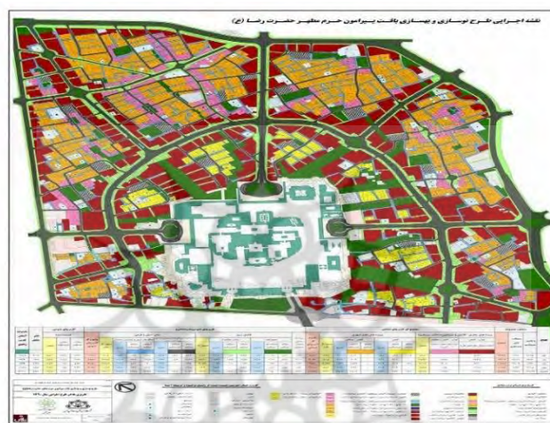
شکل ۱. موقعیت محدوده مورد مطالعه (سازمان عمران و بهسازی، ۱۳۸۷)

محدوده مورد مطالعه در این پژوهش به‌طور کلی محدوده پیرامون حرم مطهر و در واقع بخشی از منطقه ثامن با بافت فرسوده بوده که مساحت آن حدود ۱۰۱ هکتار از مجموع ۳۶۰ هکتار آن است. این محدوده در سال ۱۳۸۵ دارای جمعیت ۱۴۵۱۷ نفر بوده است. محدوده بافت فرسوده منطقه ثامن بخشی از شهر مشهد است که در یک چارچوب مشخص و معین فضایی محدود شده است و دارای نقش نمادین می‌باشد، به‌طوری‌که عناصر و قسمت‌های مهم شهر را متشکل و مجتمع ساخته و به آن‌ها وحدت و قوام می‌بخشد.