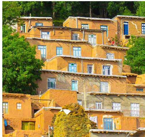
شکل (۲) تصویر منطقه مورد مطالعه