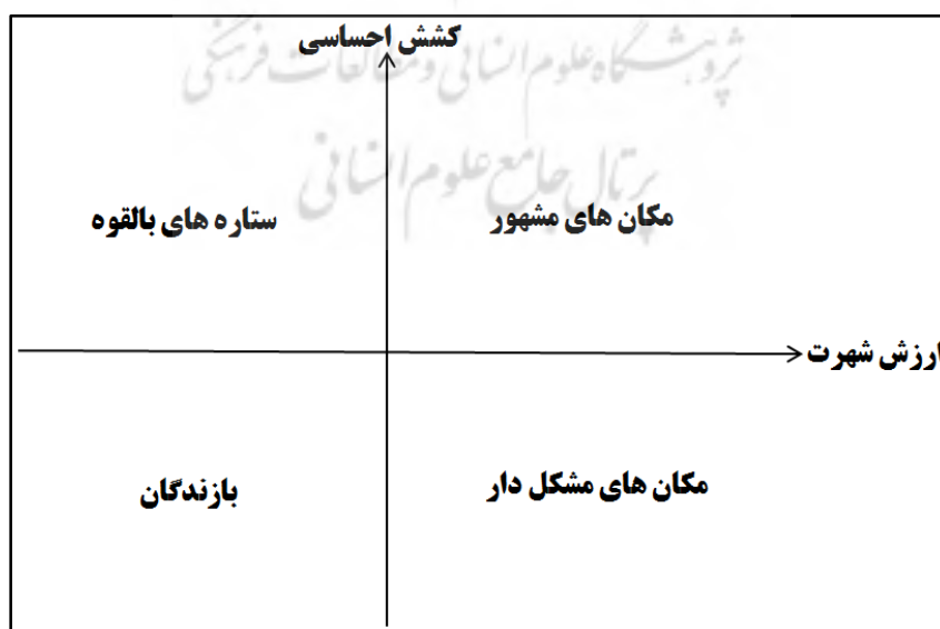
شکل ۲. ماتریس شهرت مکان

همچنین در جهت سنجش فرضیه دوم، ماتریس شهرت مکان، یکی از مدل‌های جایگاه‌سنجی برند مکانی است که در تناظری مابین شهرت مکان و کشش احساسی نسبت به سفر به مکان، جایگاه مقصد موردنظر را در چهار وضعیت ستاره‌های بالقوه، مکان‌های مشهور، مکان‌های مشکل‌دار و در نهایت بازندگان مشخص می‌نماید.