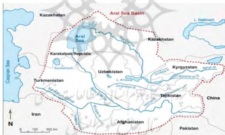
شکل ۱: محدوده‌ی دریای آرال.

رودخانه آمودریا در جنوب حوضه دریای آرال قرار دارد و طول آن ۲۵۰۰ کیلومتر و متوسط جریان سالانه آن ۳۷ کیلومتر مکعب است. از سوی دیگر، رودخانه سیردریا در شمال حوضه جاری است و طول کل آن در حوضه دریای آرال تقریباً ۲۴۰۰ کیلومتر و متوسط جریان سالانه آن نصف جریان سالانه آمودریا و ۷۹ کیلومتر مکعب است (گیبولایف ۱ و همکاران، ۲۰۱۲؛ نزلین ۲ ، ۲۰۰۴). بخش عمده‌ی مساحت حوضه زهکشی دریای آرال، تقریباً ۱۸۷۴۰۰۰ کیلومتر مربع است که توسط سیردریا و آمودریا تشکیل می‌شود. میانگین حجم آب ورودی به دریای آرال از طریق آمودریا و سیردریا به ترتیب در سال ۱۹۹۰، ۱۸،۲ و ۵،۸ کیلومتر مکعب بوده است که در سال ۲۰۱۵ به حدود ۵،۳ و ۴،۴ کیلومتر مکعب کاهش یافته است (چن ۳ و همکاران، ۲۰۲۱). آب سیردریا و شاخه‌های آن در کشورهای قرقیزستان، قزاقستان، تاجیکستان و ازبکستان جاری است، درحالی‌که آب آمودریا و شاخه‌های آن بین تاجیکستان، ترکمنستان و ازبکستان تقسیم می‌شود. دریای آرال توسط سه بیابان احاطه شده است. کیزیل کوم ۴ به معنی شن‌های سرخ در شرق، کاراکوم ۵ به معنای ماسه‌های سیاه در جنوب غربی و مویون کوم ۶ به معنی گردنه در جنوب قرار دارد. در نیم قرن اخیر به دلیل نرخ بالای تبخیر در این منطقه، سطح دریاچه آرال بزرگ ۲۳ متر و سطح دریاچه آرال کوچک ۱۶ متر کاهش یافته است. بنابراین در نتیجه دریای آرال عملاً به دریای مرده تبدیل شده است (کمالوف ۷ ، ۲۰۰۳).