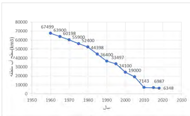
شکل ۲: تغییرات سطح آب دریای آرال از سال ۱۹۵۷ تا سال ۲۰۱۸