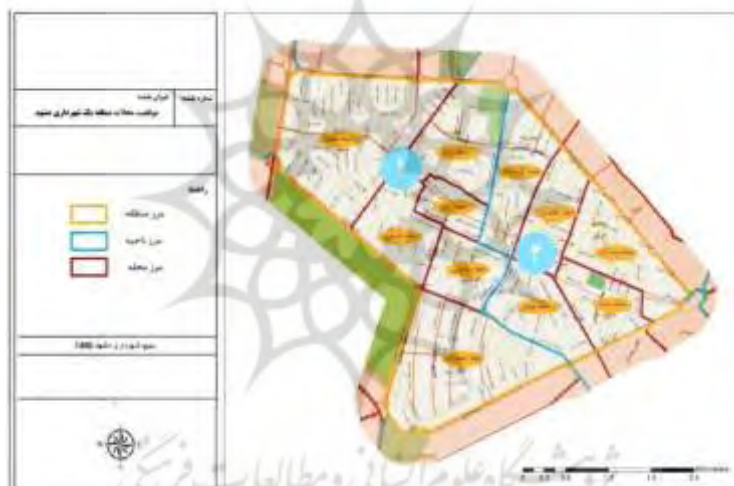
شکل ۲. منطقه یک در تقسیمات شهری شهرداری مشهد ۱۴۰۱

منطقه یک شهرداری مشهد، دارای ۱۷۴۴ هکتار وسعت بوده و از لحاظ موقعیت قرارگیری از شمال در مجاورت میدان استقلال، بلوار فردوسی، میدان فردوسی، بلوار سپهبد قرنی، خیابان توحید، میدان شهدا از شرق به خیابان دانشگاه، میدان دکتر شریعتی، خیابان کوه سنگی از جنوب به بلوار شهید محمد منتظری، میدان فلسطین، بلوار ملک‌آباد، میدان آزادی از غرب به میدان آزادی، بزرگراه آزادی، میدان استقلال منتهی می‌شود. جمعیت این منطقه بر اساس نتایج طرح اطلس محلات شهر مشهد که در سال ۱۳۹۸ توسط شهرداری مشهد انجام گرفته ۲۰۱۳۷۳ نفر در غالب ۶۵۴۳۳ خانوار برآورد شده است.