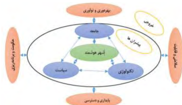
شکل ۱. چارچوب مفهومی شهرهای هوشمند

زیر نشان داده شده است (Yigitcanlar & Kamruzzaman, 2018: 56).