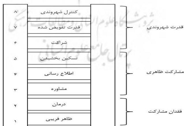
شکل ۱- نردبان مشارکت آرنشتاین