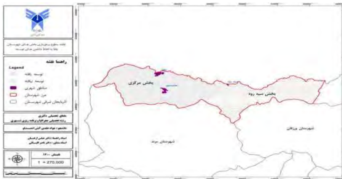
شکل شماره ۲: نقشه سطوح برخورداری بخش‌های شهرستان جلفا به لحاظ شاخص‌های توسعه