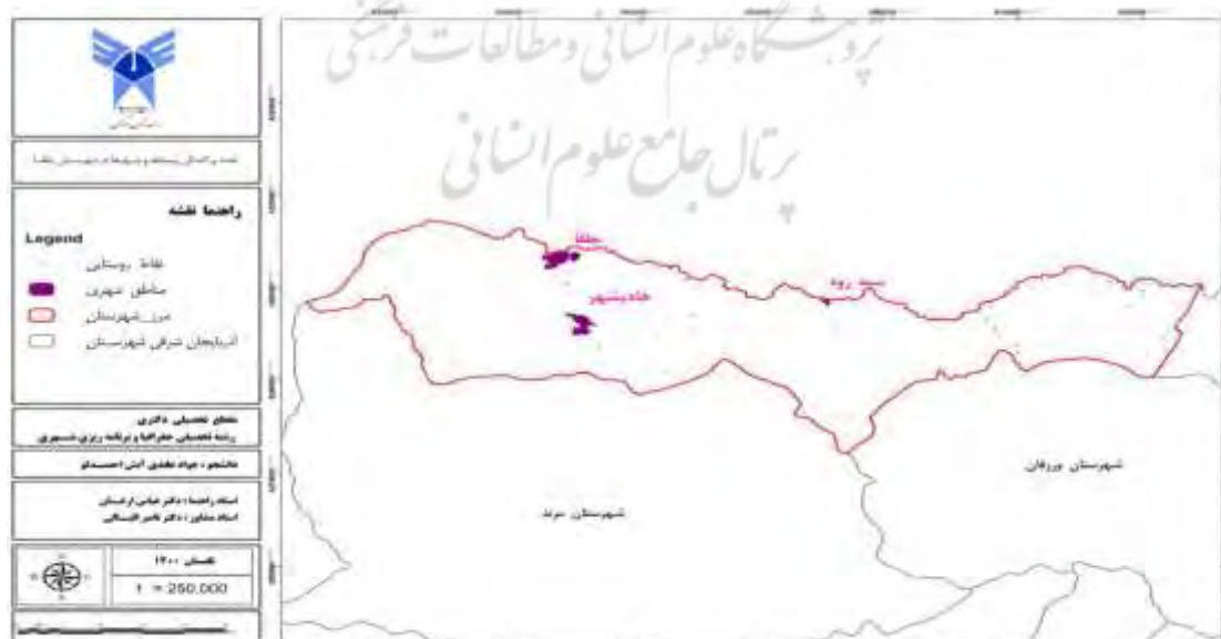
شکل شماره ۱: نقشه پراکندگی روستاها و شهرهای شهرستان جلفا

براساس تحقیقات کتابخانه‌ای و مطالعات انجام شده، منطقه آزاد ارس با مرکزیت جلفا و فاصله ۱۳۷ کیلومتری از تبریز و ۷۶۱ کیلومتری از تهران در شمال غرب کشور و در حاشیه رود ارس به طول ۱۲۸ کیلومتر، با وسعتی معادل ۵۱۰۰۰ هکتار واقع شده است. براساس مصوبه هیئت وزیران در سال ۱۳۸۴، محدوده منطقه آزاد ارس شامل ۹۷۰۰ هکتار از اراضی منطقه می‌شد که در سال ۱۳۸۷ و با مصوبه دیگری، محدوده این منطقه به ۵۱ هزار هکتار، شامل بخش‌هایی از دو شهرستان جلفا و کلیبر افزایش یافت. این منطقه آزاد، دارای پتانسیل‌های قوی برای توسعه می‌باشد. منطقه‌های ارزشمند اکولوژیکی حفاظت شده، منابع غنی آب، اقلیم مناسب، ذخیره گاه‌های جنگلی بین‌المللی، محیط زیست مناسب، قابلیت‌های توسعه گردشگری در زمینه‌های تاریخی، فرهنگی، طبیعی، ورزشی، مذهبی و تحصیلی، از پستوانه‌ها و پتانسیل‌های این منطقه می‌باشند (Ghanbarpur, 2021:13). در زیر نقشه نقشه پراکندگی روستاها و شهرهای شهرستان جلفا و نقشه سطوح برخورداری بخش‌های شهرستان جلفا به لحاظ شاخص‌های توسعه جهت توضیح و ترسیم بیشتر موضوع ارائه شده است. در این پژوهش شهرهای بخش مرکزی جلفا، شهر جلفا و هادیشهر و بخش سیه رود به عنوان شهرهای پیرامونی مورد مطالعه می‌باشند، که در نقشه شماره ۱ پراکندگی این مناطق ارائه شده است.