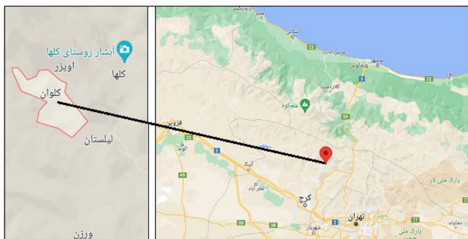
شکل ۲. موقعیت محدوده مورد مطالعه

کلوان، روستایی واقع در دهستان آدران از توابع بخش آسارا - شهرستان کرج در استان البرز ایران - است. این روستا در نزدیکی قله کهار (کاهار در زبان محلی) قرار گرفته است و طبیعتی شگفت‌انگیز دارد. وسعت روستا کمی بیشتر از هزار هکتار است و در حال حاضر ۲۲۴ خانوار در آن زندگی می‌کنند (شکل ۲).