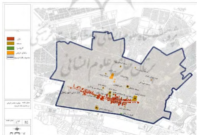
شکل ۲. موقعیت نقاط گردشگری شهر زنجان