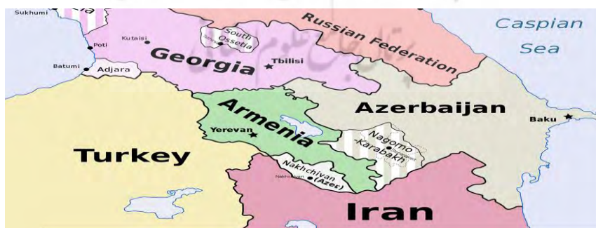
شکل ۱. موقعیت ژئوپلیتیکی قفقاز جنوبی

قفقاز جنوبی از نظر اقتصادی، منابع طبیعی، چشم‌اندازهای اقلیمی، تاریخی و فرهنگی از مناطق بسیار مهم در جهان و محل تلاقی اروپا و آسیا از یک نظر و اسلام و مسیحیت از لحاظ دیگر است و از حیث سیاسی نیز این منطقه اهمیت بسیار سوق‌الجیشی دارد؛ به طوری که از دیرباز مدنظر قدرت‌های بزرگ بوده است. قفقاز یکی از قدیمی‌ترین مراکز تمدن بشری است و تمدن ایرانی از دوره هخامنشی، یعنی ۶۰۰ سال پیش از میلاد در این منطقه حضور داشته است. در این دوره، دولت‌های گرجستان، آذربایجان و ارمنستان یا جزو ایالات یا خراج‌گذار ایران بوده‌اند. در کتیبه داریوش بزرگ، پادشاه هخامنشی، در بیستون کرمانشاه، از منطقه قفقاز به‌عنوان ایالتی که داریوش بر آن تسلط دارد، نام برده شده است و مردم آن به اطاعت از وی و دادن خراج وادار شده‌اند (شفایی، ۱۳۸۸، ص. ۱۵۹). به لحاظ تاریخی، قفقاز مورد ادعای ایران، روس و امپراطوری عثمانی بوده است. این منطقه اخیراً اهمیت بسیاری کسب کرده است و علت آن منابع انرژی حوزه خزر و مسیرهای عبور خطوط انتقال انرژی است که این منطقه را به درون آسیای مرکزی پیوند داده است. این منطقه همچنین پیوند راهبردی مهمی را بین روسیه و ایران فراهم می‌کند. از زمان افول و فروپاشی شوروی سابق، این ناحیه که به لحاظ قومی و زبانی بسیار متنوع است، صحنه یک‌سری از نبردها بین بازیگران داخلی و نیروهای خارجی بوده است (ناظم رعایا و هالیدی، ۲۰۱۲، ص. ۳۸۹).