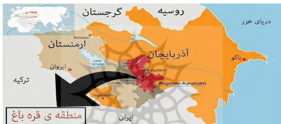
نقشه ۲. موقعیت جغرافیایی قره‌باغ

ورود آنکارا به این مناطق محسوب می‌شود (محمود اوغلی و همکاران، ۱۴۰۱، ص. ۹۵). ترکیه به لحاظ راهبردی سعی دارد از طریق روابط اقتصادی، سیاسی، فرهنگی و حتی نظامی با دولت‌های ترک‌زبان به‌ویژه جمهوری آذربایجان جایگاه خود را در قفقاز جنوبی ارتقا بخشد. در نقشه «جهان ترک» که اخیراً نمایندگان احزاب ناسیونالیست به اردوغان تحویل داده‌اند، جمهوری آذربایجان، تمام آسیای مرکزی، برخی از مناطق ایران، مغولستان و بخش‌های بزرگی از روسیه با عنوان «دنیای ترک» برجسته شده‌اند (هایراپتیان، ۲۰۲۲، ص. ۳۹).