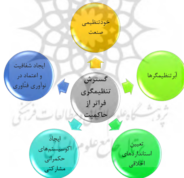
شکل ۳: گسترش تنظیمگری فراتر از حاکمیت

اگر دولت دیگر نمی‌تواند به تنهایی حکمرانی کافی بر فناوری‌های نوظهور در انقلاب صنعتی چهارم ارائه دهد، در آن صورت باید منابع جدیدی از قدرت برای اداره این فناوری‌ها به وجود آید. برای گسترش حکمرانی، به الگوهای جدید حکمرانی مشارکتی دولتی - خصوصی فراتر از نهادهای موجود بخش عمومی نیاز است.