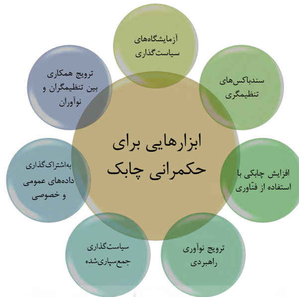
شکل ۲: ابزارهای حکمرانی چابک

در ادامه درخصوص راه‌حل‌های حکمرانی چابک (شکل ۲) توضیحات مختصری ارائه شده است.