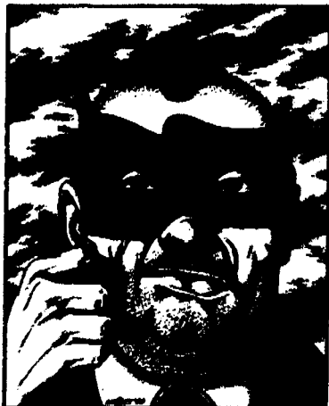
Nicolay Pecarell نقاشی و پیکاروف