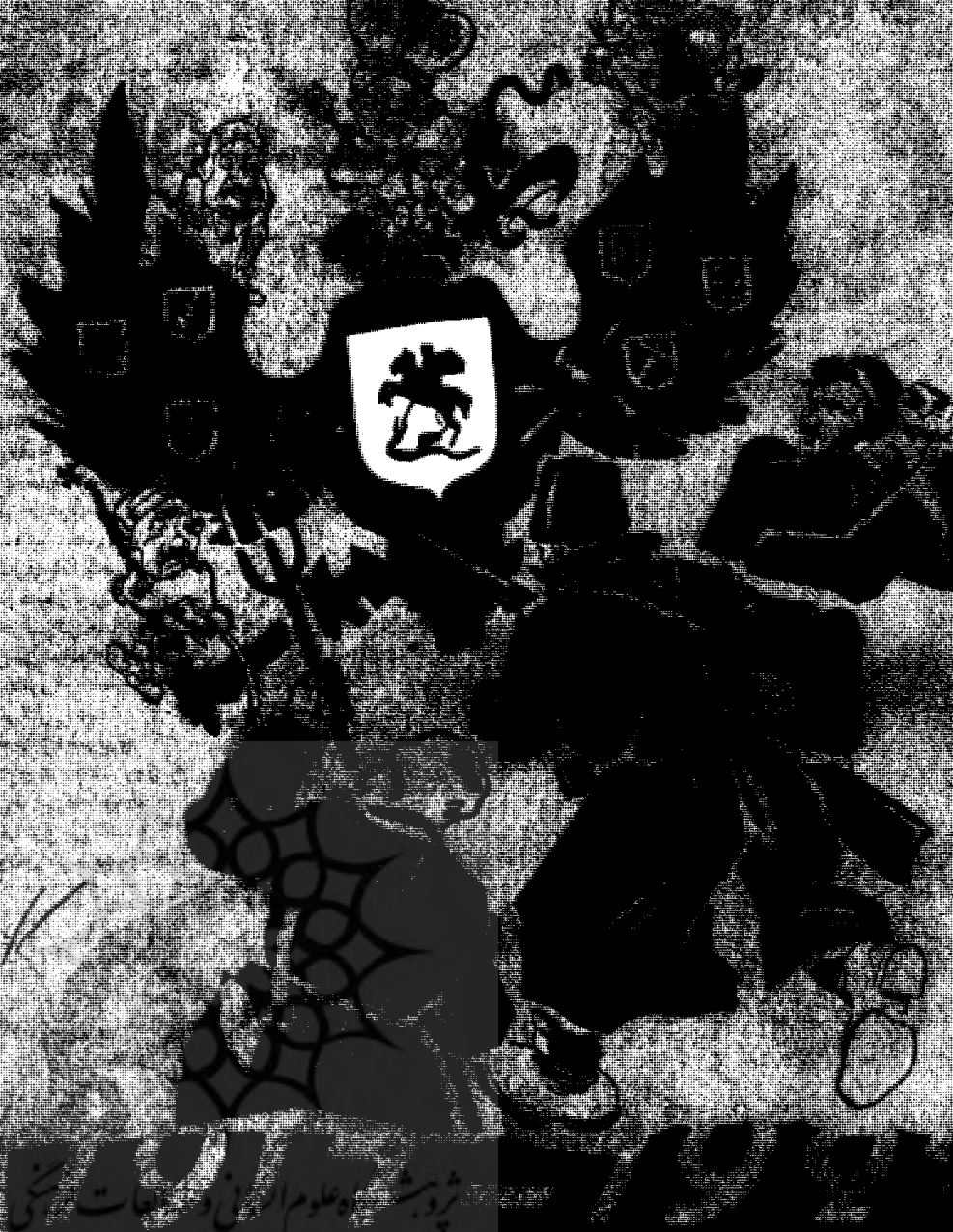
پوشاک و نمادان در سادات کنگ

در این تصویر یک مرد با کلاه و لباس نظامی ایستاده در دروازه ای و کل بزرگی را بر شانه خود حمل می کند.