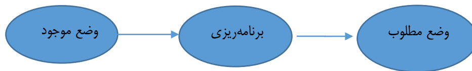
شکل ۱. هدف و ماهیت برنامه‌ریزی

برنامه‌ریزی در چارچوبی است که به آن نظام برنامه‌ریزی می‌گویند (قاسمی و پناهی، ۱۳۸۷: ۱۱). قانون اساسی بنیادی‌ترین هنجار حقوقی در اصل ۴۴، نظام اقتصادی ایران را به‌صراحت مبتنی بر «برنامه‌ریزی منظم و صحیح» ترسیم کرده است که در برنامه‌ریزی توسعه در قانون اساسی بررسی می‌شود.