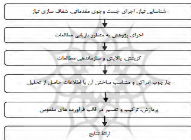
شکل ۱. الگوی شش مرحله‌ای سنتز پژوهی روبرتس

این مطالعه از لحاظ هدف کاربردی و از لحاظ روش و ماهیت جزو تحقیقات توصیفی-پیمایشی است. همچنین از لحاظ استراتژی، کیفی - کمی است. در این مطالعه روش گردآوری اطلاعات در سه مرحله انجام شد؛ در مرحله اول به منظور طراحی الگو با استفاده از مطالعات کتابخانه‌ای از جمله مطالعه کتب و نشریات داخلی و خارجی و جستجو در پایگاه‌های اطلاعاتی (اینترنت) استفاده گردید؛ بدین صورت که با توجه به مبانی نظری و عملی تحقیق عوامل مؤثر بر بزه دیدگی جنسی مشخص گردید. در مرحله بعد معیارهای به‌دست‌آمده با استفاده از الگوی شش مرحله‌ای روبرتس سنتز شده و مؤلفه‌های تکراری حذف گردیده و در نهایت معیارهای مطلوب انتخاب گردید (شکل ۱).