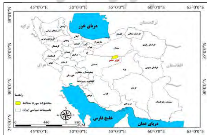
شکل ۱. موقعیت منطقه مورد مطالعه بر روی نقشه ایران

مصر روستایی کوچک در دل کویر مرکزی ایران، حد فاصل استان‌های اصفهان، سمنان و خراسان است که در ۴۵ کیلومتری شرق جندق و ۳۰ کیلومتری شمال خور از توابع استان اصفهان قرار دارد. موقعیت جغرافیایی روستا 34^{\circ} 04' شمالی و 54^{\circ} 47' شرقی است. مصر یکی از روستاهای گردشگری پذیر شهرستان خور و بیابانک محسوب می‌شود. این روستا، مقصد گردشگری کلیه گردشگران ورودی به شهرستان بوده و به دلیل داشتن جاذبه‌های بکر کویری چسبیده به روستا، وجود خدمات گردشگری نوین و فرهنگ و سنن و معماری خاص، مورد توجه گردشگران قرار گرفته است. اهمیت این روستا به دلیل قرار گرفتن آن در دل منطقه کویر مرکزی ایران است. در واقع این روستا یکی از آخرین نقاط تمدن در منطقه است که با داشتن آب، تمدنی در این منطقه خشک ایجاد کرده است. طی سال‌های اخیر نیز چند نفر از افراد با ذوق، با احداث خانه‌هایی، اقامتگاهی مناسب را برای گردشگران منطقه ایجاد کرده‌اند. مساحت تقریبی این محدوده بالغ بر ۱۷۵۱۵۵ هکتار است. این روستاها از جمله مقصدهای کویرنوردی سال‌های اخیر هستند که سالانه حدود ۲۸۰۰۰ گردشگر را پذیرا بوده‌اند. منطقه کویر مصر در حال حاضر پذیرای گردشگران داخلی از استان‌های تهران، اصفهان و گردشگران خارجی به ویژه از کشورهای اروپایی همچون آلمان و فرانسه است. روستای مصر به دلیل قرار گرفتن در جنوب کویر بزرگ دارای آب و هوای گرم و خشک و بیابانی است. میزان متوسط بارندگی آن کمتر از ۱۰۰ میلی‌متر در سال است. از ویژگی‌های آب و هوایی منطقه متوسط بالای درجه حرارت، تبخیر زیاد، بارندگی کم، رطوبت نسبتاً ناچیز و اختلاف شدید درجه حرارت در شب و روز است.