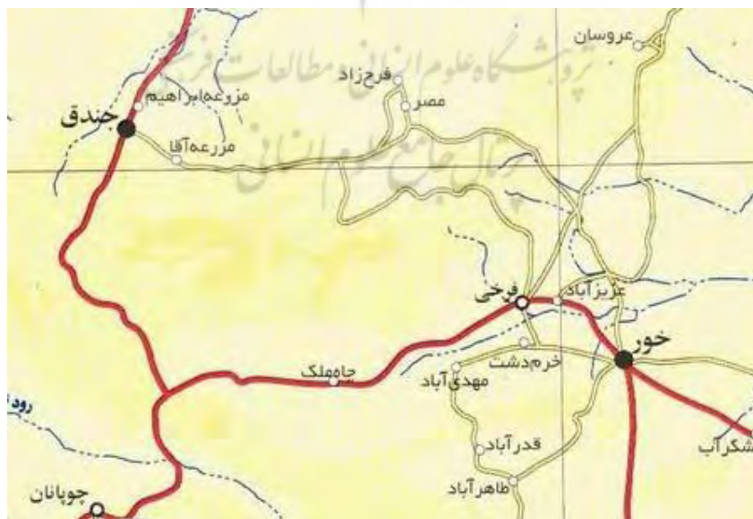
شکل ۲: نقشه‌ی کویر مصر

مورد مطالعه‌ی پژوهش حاضر، کویر مصر است که در منطقه‌ی خور و بیابانک نزدیکی نائین در شمال شرق اصفهان با مختصات 4^{\circ} 34' عرض جغرافیایی و 54^{\circ} 47' ارتفاع، واقع شده است (سبک‌خیز و همکاران، ۲۰۱۶). منطقه‌ی کویری مصر در حال حاضر پذیرای گردشگران داخلی از استان‌های تهران، اصفهان و گردشگران خارجی به‌ویژه از کشورهای اروپایی همچون آلمان و فرانسه است (حسن‌پور و همکاران، ۱۳۹۰: ۱۸۸). روستای مصر در ۴۵ کیلومتری شرق شهرستان جندق و در ۳۰ کیلومتری شمال شهرستان خور از توابع استان اصفهان قرار دارد. موقعیت جغرافیایی روستا 34^{\circ} درجه و 4^{\circ} دقیقه شمالی و 47^{\circ} درجه و 54^{\circ} دقیقه شرقی است. روستای مصر به دلیل قرار گرفتن در جنوب کویر بزرگ دارای آب‌وهوای گرم و خشک است. جمعیت این روستا بر طبق آخرین سرشماری ۱۲۰ نفر است و مردم این روستا از طریق کشاورزی و دامداری امرارمعاش می‌کنند. نقاط دیدنی اطراف روستای مصر منطقه‌ی امیرآباد در فاصله‌ی ۲ کیلومتری روستا دارای تپه‌های شنی و پوشش گیاهی غنی از درختچه‌های گز و تاق و نخل‌های زیبا است که مناظر بسیار زیبایی را پدید آورده است. روستای فرحزاد در شمال روستای مصر دارای نخلستان‌های زیبا است که توسط شن‌های روان محصور گشته است. محصور شدن نیزار توسط شن‌های روان، جلوه‌ی منحصر به فردی به آن داده است. این نیزار آبشخور اصلی حیات‌وحش کویر منطقه است. ارتفاع نی‌ها در پاره‌ای از موارد به ۵ متر هم می‌رسد. نیزار مصر مکان مناسبی برای عکاسی از حیات‌وحش کویر است. دو راه برای دسترسی به نیزار وجود دارد. مسیر اول مسیر روستای عباس‌آباد به نیزار است و مسیر دوم مسیر روستای فرحزاد است (معینی، ۱۳۹۵: ۳۲).