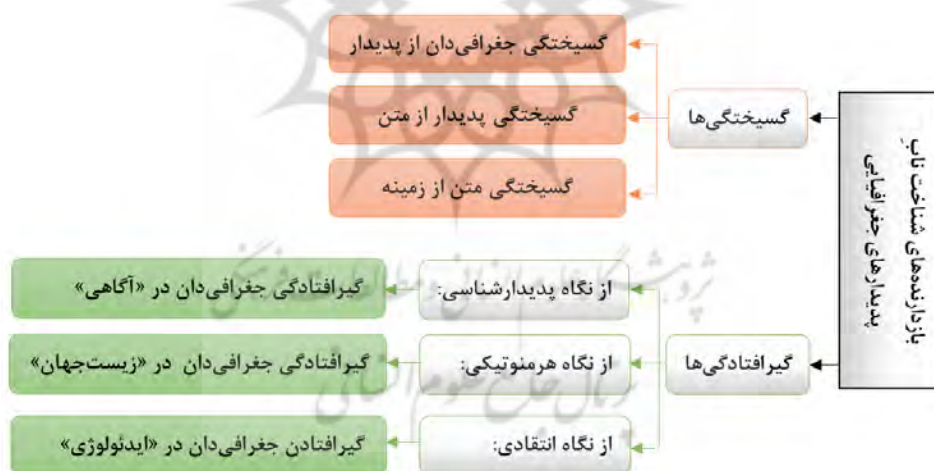
شکل ۳: بازدارنده‌های شناخت ناب پدیدار(های) فضای جغرافیایی از چشم‌انداز پدیدارشناسی هرمنوتیک

اگر از دریچه‌ی پدیدارشناسی هرمنوتیک به گونه‌ها و زیرگونه‌های روش‌شناسی‌ها (شکل ۲) بنگریم، می‌توان از دو بازدارنده‌ی بزرگی که ما را از شناخت ناب پدیدار(های) فضای جغرافیایی بازمی‌دارند، رونمایی کرد: ۱- گسیختگی (گسیختن پدیدار از جهان‌آش) و ۲- گیرافتادگی (گیرافتادن جغرافی‌دان در جهان‌آش) (شکل ۳).