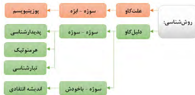
شکل ۲: گونه‌ها و زیرگونه‌های روش‌شناسی

جغرافی‌دانان افزون بر رونمایی از پدیدارها، در پی رونمایی از پدیدآورنده‌ی (علت/دلیل) آن‌ها نیز هستند، بنابراین بایسته است که گونه‌های روش‌شناسی «علت‌کاو» ۱۳ و «دلیل‌کاو» ۱۴ پرداخته شود.