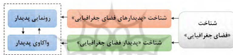
شکل ۱: شناخت فضای جغرافیایی

آگاهی از یک چیز، است. هنگامی که می‌شناسیم، «چیزی» را می‌شناسیم (صانعی دره‌بیدی، ۱۳۸۴: ۳۲۶). به باور هوسرل، هر آگاهی‌ای، ناگزیر، «آگاهی از ...» است (جمادی، ۱۳۹۲: ۳۴۷)، بنابراین هنگامی که می‌گوییم شناخت فضای جغرافیایی، بی‌درنگ باید گفت شناخت چه چیزی از آن؟ «آگاهی از» چه چیزی؟ شناخت «پدیدار فضای جغرافیایی» بسان یک کل؟، یا شناخت «پدیدارهای درون فضای جغرافیایی» مانند: حاشیه‌نشینی، عدالت، فقر و ...؟ زیرا از دید پدیدارشناسی اگر «چیزی» نباشد، شناخت و آگاهی‌ای نخواهد بود. در فلسفه‌ی پدیدارشناسی هوسرل، ذات، از راه حیث‌التفاتی بودن ۷ است که به پدیدار تبدیل می‌شود (صانعی دره‌بیدی، ۱۳۸۴: ۲۴۵) بنابراین باید قصد شناخت چیزی را کرد، تا «پدیدار» شود. پیشینه‌ی این کار به ارسطو می‌رسد؛ زیرا او نیز بر این بود که ادراک، همواره به مفعول (بژه) نیاز دارد. به باور هوسرل نیز، ادراک و شناخت (اعم از احساس، تخیل، تعقل، شهود و استدلال و ...) حیث‌التفاتی است. اگر رنگ نباشد، دیدن رخ نمی‌دهد، اگر صدا نباشد، شنیدن رخ نمی‌دهد و ... بنابراین در فرآیند شناخت، سه عنصر - فاعل شناخت، موضوع شناخت، و عمل شناخت - وجود دارد؛ یعنی عمل دیدن نیاز به دو عنصر - فاعل و متعلق دیدن - دارد. بیننده به شرط آن که ببیند، بیننده است (همان: ۲۴۵). بنابراین در شناخت فضای جغرافیایی نیز باید: ۱- جغرافی‌دانی باشد (فاعل شناخت)، ۲- فضای جغرافیایی‌ای برای شناخت باشد (موضوع شناخت) ۳- جغرافی‌دان، آهنگ شناخت فضای جغرافیایی کند (عمل شناخت).