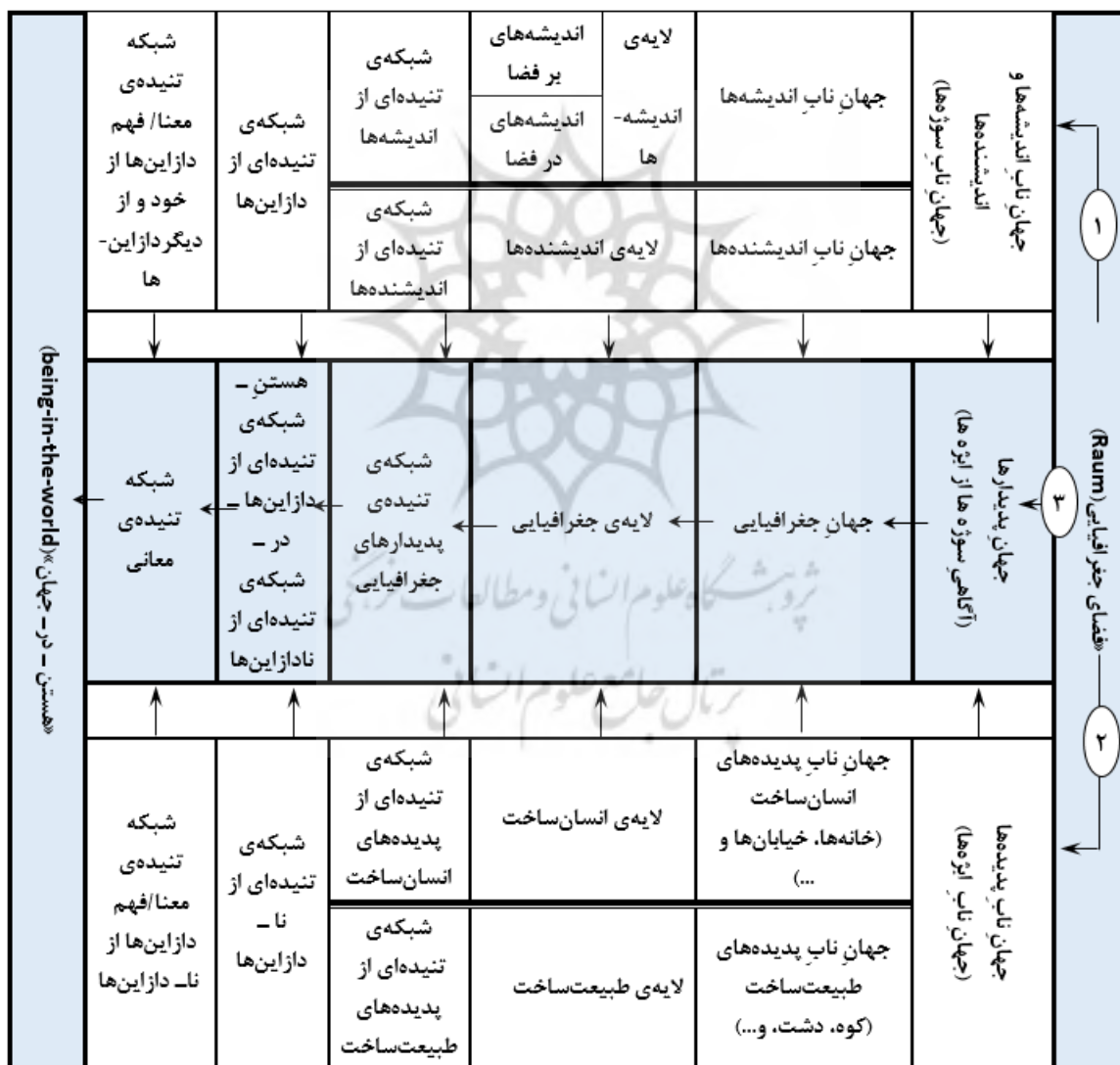
شکل ۴: دستگاه برهان‌های فلسفی - جغرافیایی

اگر با همان الگوی سوژه - ایزه‌ی سنتی که در آن سوژه‌ی مشاهده‌گر در برابر جهانی متشکل از جمیع هستندگان ایستاده است (ملاپری، ۱۳۹۰: ۲۱۸) به فضای جغرافیایی (Raum) بنگریم، می‌توان آن را - در ذهن، و نه در واقعیت -