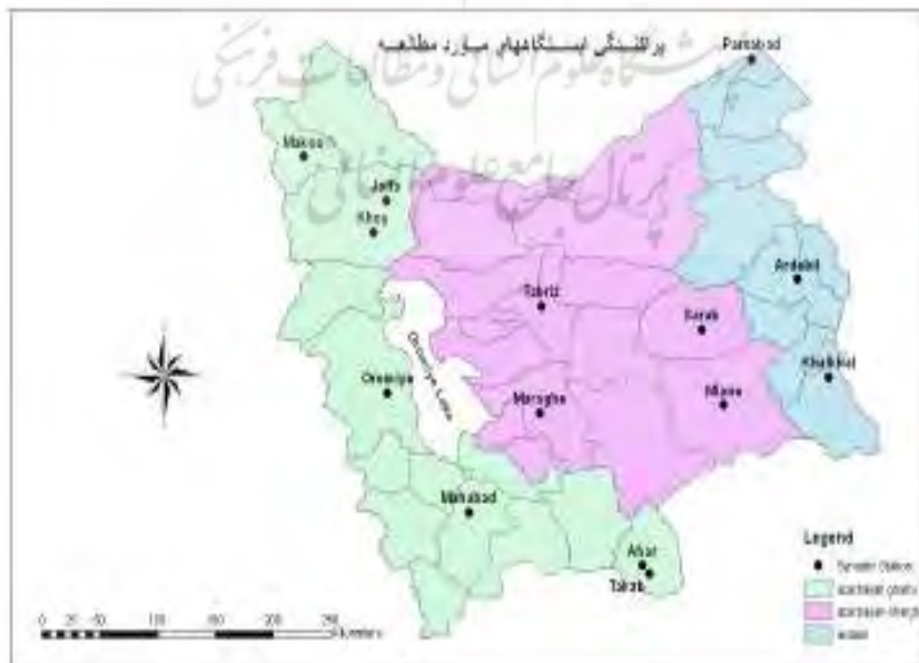
شکل (۱) محدوده و پراکندگی ایستگاه‌های مورد مطالعه

منطقه مورد مطالعه با وسعت تقریبی ۱۲۰۵۰۰ کیلومتر مربع بین ۳۴ درجه و ۵۸ دقیقه تا ۳۹ درجه و ۴۹ دقیقه عرض شمالی و ۴۴ درجه و ۳ دقیقه تا ۴۸ درجه و ۵۹ دقیقه طول جغرافیایی گسترده شده است. این منطقه از شمال به جمهوری آذربایجان و ارمنستان، از غرب به ترکیه و عراق، از شرق به جمهوری آذربایجان و استان گیلان و از جنوب به استان‌های کردستان و زنجان محدود می‌شود. این منطقه از نظر طبیعی واحد جغرافیایی مشخصی است و از نظر سیاسی به سه استان آذربایجان غربی، آذربایجان شرقی و اردبیل تقسیم شده است. شکل شماره (۱) محدوده و پراکندگی ایستگاه‌های مورد مطالعه را نشان می‌دهد.