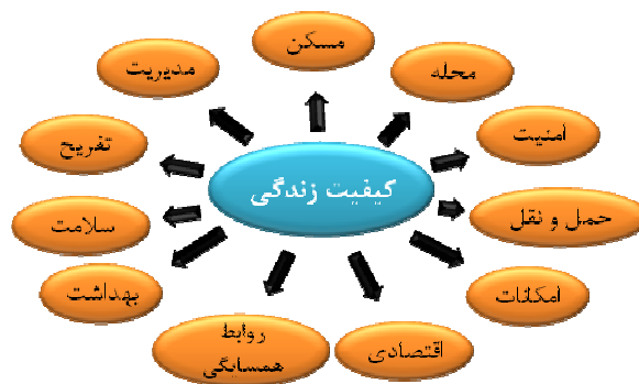
شکل (۲): شاخص‌های پژوهش

از آن جایی که مفهوم کیفیت زندگی شهری، مفهومی چند بعدی و پیچیده می‌باشد، زمانی می‌توان از آن در برنامه‌ریزی شهری استفاده کرد؛ که چهار چوبی مناسب و قابل اطمینان برای سنجش آن تدوین نمود. بنابراین، اولین گام در راستای سنجش کیفیت زندگی شهری انتخاب ابعاد آن و سپس انتخاب شاخص‌هایی است که با استفاده از آن بتوان ابعاد مختلف کیفیت زندگی شهری را مورد سنجش قرار داد (لطفی، ۱۳۸۸: ۷۱). بر این اساس شاخص‌های انتخابی در این پژوهش شامل ۱۱ معیار می‌باشد؛ که در شکل (۲) آمده است.