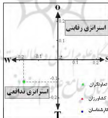
شکل ۲: موقعیت استراتژی ها از نظر گروه های آماری