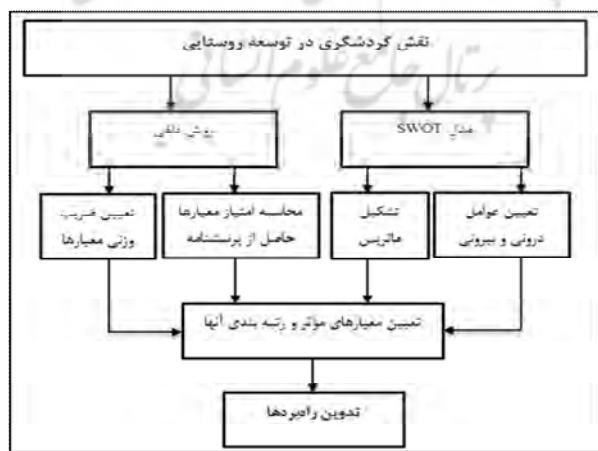
شکل ۳: مدل مفهومی از روش ترکیبی سوات- دلفی

روش تحقیق توصیفی- تحلیلی بوده و اطلاعات مورد نیاز آن از طریق منابع کتابخانه‌ای و عملیات میدانی (پرسش نامه) گردآوری شده است. جامعه آماری تمامی ساکنان روستاهای مورد مطالعه واقع در ناحیه تفتان شهرستان خاش هستند، که در سال ۱۳۹۱ شامل ۵۴۶۳ نفر می‌باشند. جامعه‌ی نمونه را ۱۴۰ نفر از نخبگان محلی و ۴۰ نفر از کارشناسان بومی (در نهادهای دولتی) تشکیل می‌دهند. در این پژوهش جاذبه‌ها، محدودیت‌ها، فرصت‌ها و تهدیدات بخش گردشگری در روستاهای هدف با روشی ترکیبی (ترکیب سوات (SWOT) و دلفی (Delphi)) مورد تبیین و تحلیل قرار گرفته و در نهایت جهت بهره‌برداری بهینه از صنعت گردشگری و توسعه‌ی آن راه‌بردهایی تدوین شده است (شکل ۳). سپس روستاهای مورد مطالعه به لحاظ قابلیت بهره‌برداری از صنعت گردشگری و توسعه‌ی آن، به وسیله‌ی فن ریاضی تاپسیس (TOPSIS) رتبه‌بندی شده‌اند.