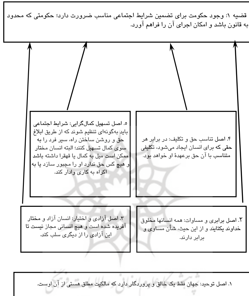
شکل ۲ مبانی استدلالی استنباط قضیه اول

جدول ۶ نیز مجموعه قضایای استنباط شده از نظام منطقی نهایی معرف عدالت حق‌مدار را ارائه می‌دهد.