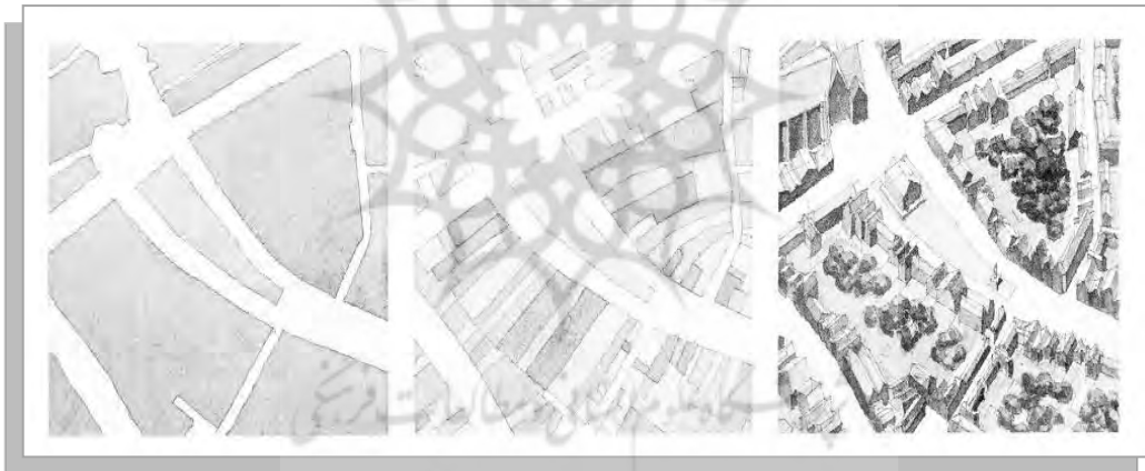
شکل (۱) عناصر اصلی سازنده‌ی نقشه‌ی شهر از دید کانزن (خیابان، قطعه زمین، ساختمان)

منظر شهری از دید کانزن یک «پالیمپست» ۲ از جامعه و فرهنگ است که صورت‌های بعضی دوره‌های زمانی معین در آن برجسته‌ترند و صورت‌های دوره‌های دیگر در طول زمان در آن محو شده‌اند. تحقیق تجربی وی عمدتاً بر خوانش و تفسیر «نقشه‌ی شهر» متمرکز است، اما او روش خود را بر سه محور استوار می‌داند: ۱- نقشه‌ی شهر ۳ یا الگوی خیابان‌ها (یک پلان دو بعدی ترسیم شده از شکل فیزیکی شهر) ۲- بافت ساختمان‌ها ۴ (متشکل از ساختمان‌ها و فضاهای باز وابسته به آن‌ها) ۳- الگوی کاربری زمین ۵ و ساختمان‌ها (کاربری تفضیلی زمین) (Conzen, 1960:4) به عبارت ساده‌تر کانزن روش «تحلیل نقشه‌ی شهر» ۶ را شامل بررسی سه عنصر خیابان، قطعه زمین و خود ساختمان می‌داند که مانند قطعات یک جورچین درهم چفت شده‌اند.