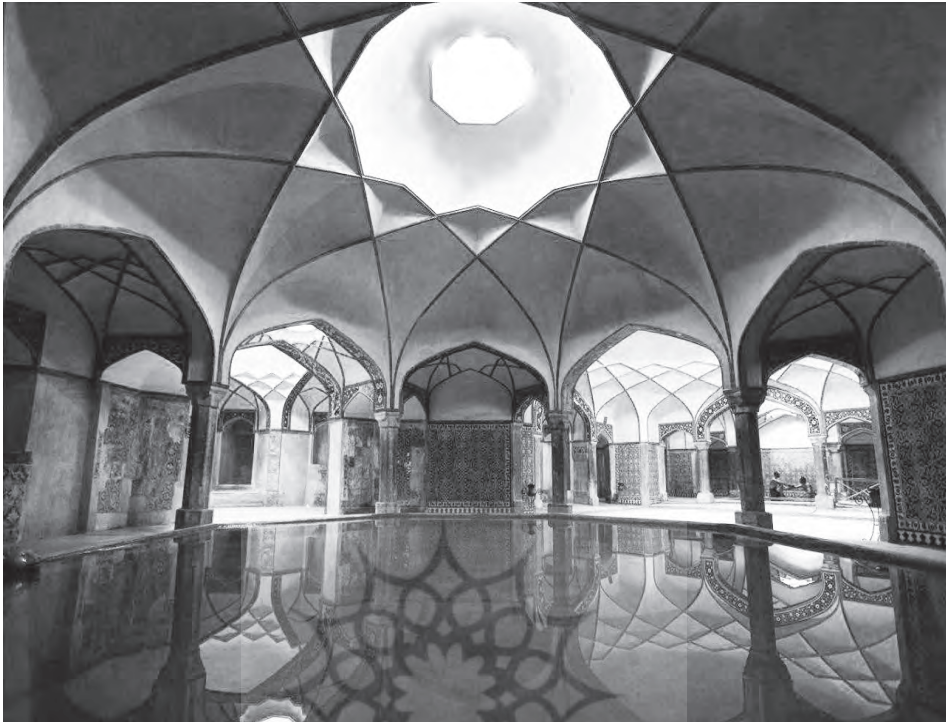
حمام گنجعلی خان

شاه طهماسب بنام بزرگ دیگری چون «سلطان محمد نقاش تبریزی» برمیخوریم که سبک تبریز (دوره دوم) و آثار گوناگون او از شهرت و ویژه‌یی برخوردار است. بر این اساس میتوان گفت تلفیق سلطان و استاد نشانه اقتدار و عظمت بسیار و جایگاه رفیع محمد معمار یزدی بوده است. باری در زمان صفویه، آنچه را که نمیتوان در یزد دیدار کرد، سازندگی و عمران و آبادانی است، زیرا در این روزگار مسائل سیاسی و مذهبی، بویژه تصوف، جایی برای حضور مقوله‌هایی چون ساخت‌وساز و کارهای عمرانی و بناهای ماندگار باقی نگذاشته بود.