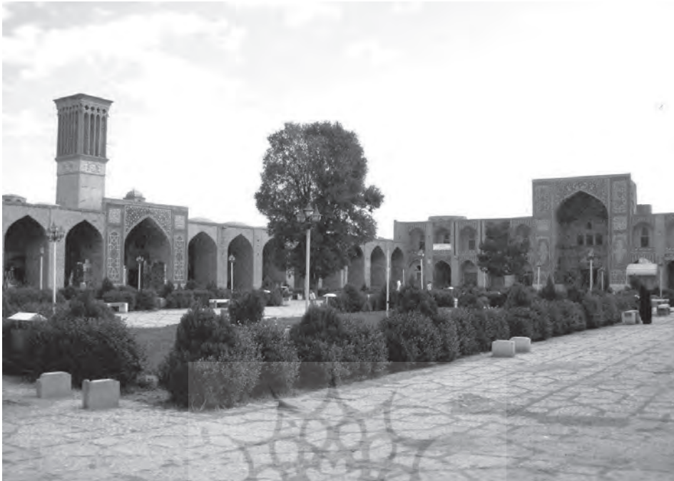
مجموعه گنجعلی خان