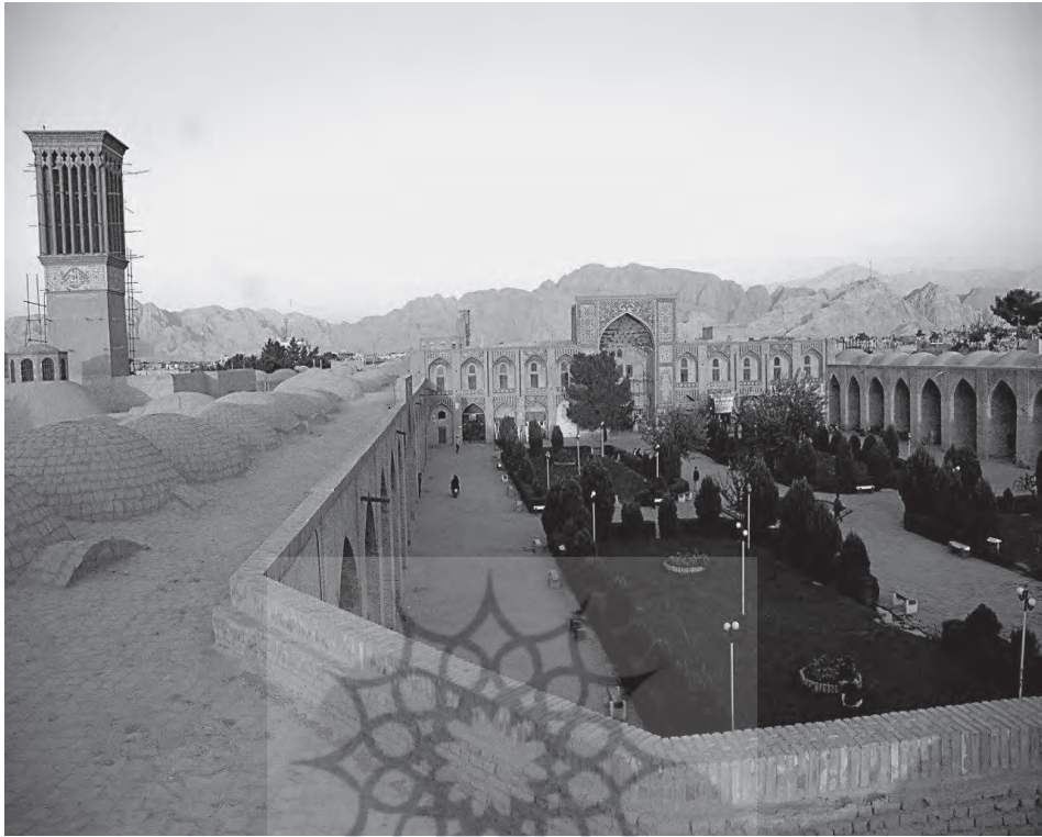
مجموعه گنجعلی خان

شده در ساخت مدارس، ابتدا اتابکان سپس آل مظفر و در سطحی کمتر، تیموریان جای داشتند، اما برغم اعصار یاد شده، در دوران نخستین صفوی، ساخت مدارس در یزد دچار چنان افتی گردید که مطابق با اسناد و آثار بجای مانده، تنها از مدرسه مصلی خبر داریم» (همان: ۳۵۴). اینک روشن می‌گردد که چرا سلطان محمد معمار یزدی، مهجور دارالعباده، مشهور دارالامان میشود؛ هر چند که باز هم روشن نیست گنجعلیخان از کجا و چگونه به این گنج هنر دست یافته و او را به کرمان برده و ساخت مجموعه ارزشمند و گرانبهای خود را به او سپرده است؟ دور نیست که با توجه به شناخت شاه عباس از وجود چهره‌های برجسته معماری همچون صنیع الدوله معمار یزدی، به گنجعلیخان سفارش کرده باشد تا در این زمینه به کنکاش و پژوهش پردازد و آنها را شناسایی نماید و از بهترینهایشان بهره ببرد. شاید این پرسش مطرح شود که اگر چنین شناختی از او وجود داشته و گنجعلیخان - به آسانی یا دشواری - توانسته وی را کشف کند، پس چرا بزرگان دیروز و امروز این دیار، حتی نامش را هم در جایی ذکر نکرده‌اند؟ مثلاً کتاب یزد عصر صفوی در حالی که از همه