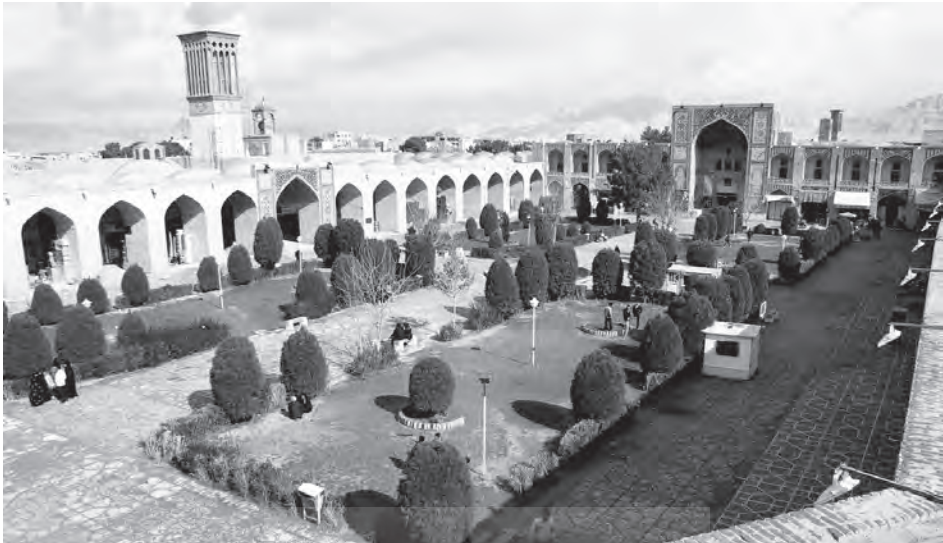
مجموعه گنجعلی خان

نکته دیگر تقوی و پاکدستی معمار یزدی است که در جای جای آثارش، نشانه‌های آن را میتوان یافت. همچنین دل‌بستگی او به آستان مقدس حضرت علی بن موسی‌الرضا (ع) را نیز باید یاد کرد؛ انسی که معمار را با گنجعلی‌خان پیوند بیشتری بخشیده است، زیرا میدانیم که او به حضرتش ارادت ویژه‌ی داشته و این موضوع از روی وقفیات او و نیز انتخاب محل دفنش - در آستانه حضرت رضا (ع) - کاملاً پیداست.