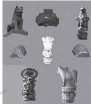
تصویر شماره ۳۱) برخی از مشهورترین سر ستونهای هنر مائوری، طرح: نگارنده

یکی از مهمترین تفاوت‌های موجود در سبک ستونهای دو کشور، استفاده از ستونها در قالب یک مجموعه معماری با وظایف مشخص در سازه بنا در معماری هخامنشی است، اما در معماری مائوری بطور کلی ستونها به استثنای تالار ستون‌دار چاندرا گوپتا در پاتالی پوترا، بصورت منفرد و تزئینی استفاده شده‌اند.