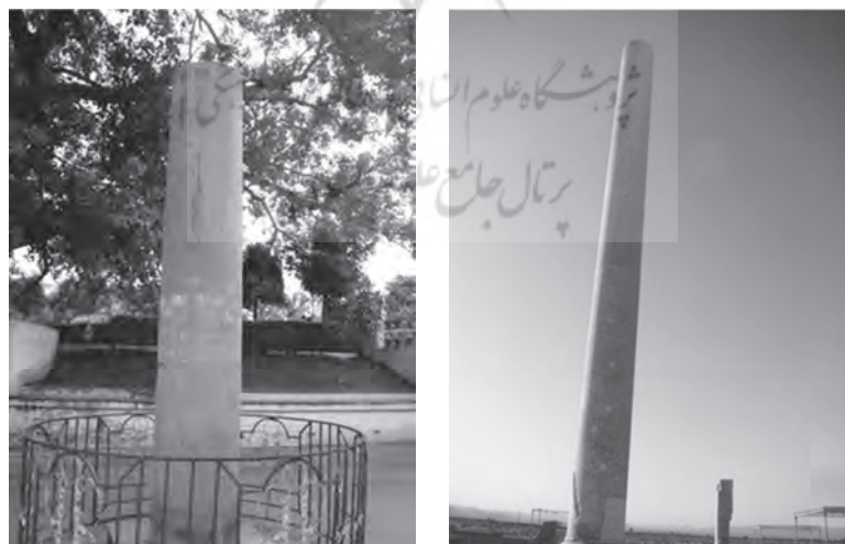
تصویر شماره ۲۹) سمت راست: نمونه ستونهای پاسارگاد تصویر شماره ۳۰) سمت چپ: ستون آشوکا در بودگایا

سرستونهای هخامنشی و مائوری از منظر ساخت و طراحی نیز اگرچه از الگویی واحد و بسیار مشابه استفاده میکنند، اما تفاوتهایی نیز با یکدیگر دارند. در سرستونهای هخامنشی شاهد استفاده از طرح برگهای نخل و وجود دو حیوان یا انسان پشت به پشت هستیم، در حالی که در سرستونهای مائوری عموماً یک حیوان منفرد استفاده شده و بجز حیوانات مشترکی مانند شیر و گاو که در هر دو نمونه دیده میشود، در هنر مائوری از حیواناتی مانند فیل که ویژه و خاص هندوستان است نیز برای سرستون‌سازی بهره برده شده است.