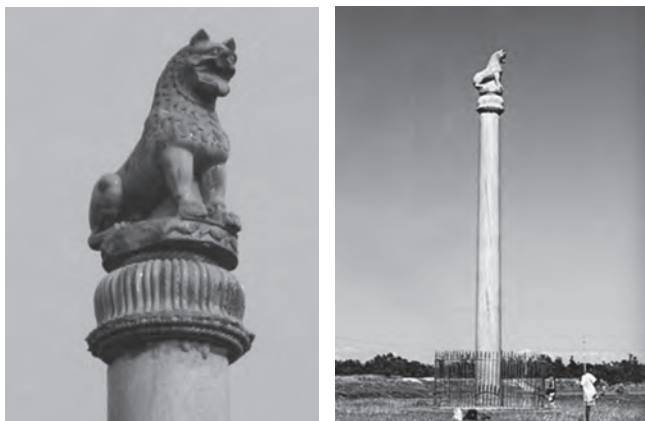
تصاویر شماره ۷ و ۸) سرستون آراجا (Araraja Pillar) از عصر آشوکا؛ منبع: http://eastchampan.bih.nic.in

این تغییرات سیاسی با تغییرات سبک معماری و هنر در هندوستان همراه است که نشانه‌های انکارناپذیری از حضور سبک معماری و هنر هخامنشی در هندوستان پس از فروپاشی این امپراتوری است (Howe, Garvin, 2015: 101).