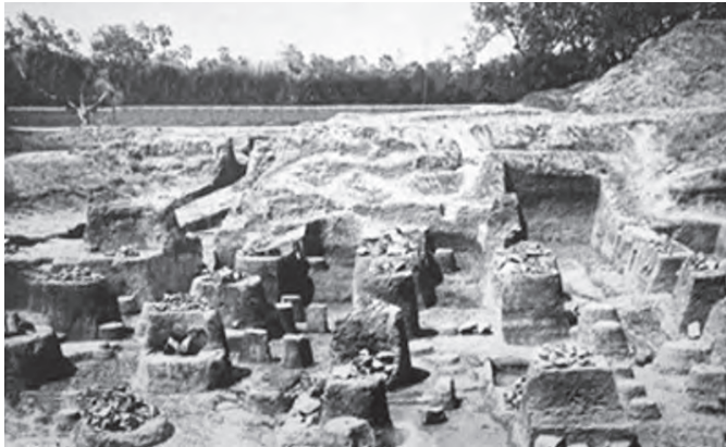
تصویر شماره ۳) تصویر امروزی همان محل که توسط نگارنده گرفته شده و متأسفانه این سایت برای حفاظت بطور کلی از ماسه پوشانده شده است: ۲۰۱۵ م.

در سال ۱۹۲۵ م. E. Hultzsch، خاورشناس آلمانی به مطالعه و انتشار کتیبه‌های نقر شده آشوکا در ستونهای سنگی ۱ پرداخت. همزمان با این مطالعات، پایتخت پادشاهان مائوری یعنی شهر پاتالی پوترا در پاتنای امروزی که مرکز ایالت بیهار در شمال شرق هندوستان است، مورد کاوش قرار گرفت و در سال ۱۹۱۲ م. توسط اسپونر ۲ از زیر خاک خارج شد. وی بعدها در سال ۱۹۱۹ م. برخی از یافته‌های این حفاری را در کتابی با عنوان تصاویر دیدار گنج ۳ منتشر کرد. همزمان با این مطالعات، در سایر مناطق هندوستان نیز نمونه ستونهایی از عصر مائوری مانند ستون مشهور سارانات ۴ بدست آمد و قطعات پازل شکلگیری این معماری جدید در هندوستان را تکمیل کرد. در سالهای ۱۹۱۴ و ۱۹۱۵ م. منطقه سارانات توسط هارگریوز ۵ حفاری شد و علاوه بر ستونهای سنگی، صدها قطعه مجسمه نیز کشف گردید. رفته رفته پژوهشگران با مطالعه این سبک معماری به شباهتهای شگفت‌انگیزی بین تمدن هخامنشی و سبکهای هنر و معماری این تمدن و تکرار آن در هنر و معماری مائوری پی بردند و مطالعات در زمینه چگونگی این انتقال فرهنگ و هنر آغاز شد (Dhammika, 1993:75). بررسی شواهد موجود و سبک تزئینات و ساخت ستونهای مائوری همگی حاکی از سطح بسیار بالای هنر و مهارت بود که با توجه به فقدان پیشینه این نوع