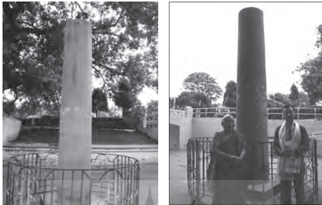
تصاویر ۱۸-۱۹) ستون آشوکا در معبد بودائی بودگایا «Bodhgaya» با بدنه‌ی صاف و بدون تراش، منبع: نگارنده، ۲۰۱۶ م.

آن در پاسارگاد دیده شده و برخلاف ستونهای تخت جمشید که دارای سرستون هستند، تالار ستون دار چاندرا گوپتا فاقد این عنصر است.