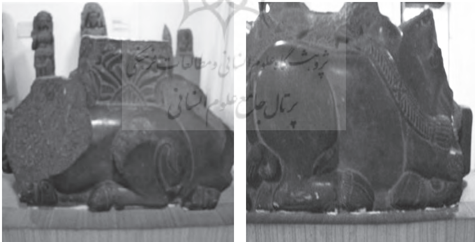
تصاویر شماره ۲۵-۲۶) سرستون عصر آشوکا با تصویر دو گاو نشسته و پشت به پشت، موزه مرکزی پاتنا

یکی از مهمترین مواردی که باید در مورد سبک ستونهای سنگی مائوری به آن اشاره کرد، استفاده از یک قطعه سنگ یکپارچه در بدنه ستونهاست، در حالی که هخامنشیان برای ساخت ستونهای خود از قطعاتی مجزا استفاده میکردند که توسط بستهای دم چلچله‌یی به یکدیگر وصل میشد. این روش اتصال قطعات در هنر مائوری برای اتصال ستون به سرستونها مورد استفاده قرار گرفته است. البته در ستونها و تالارهای ستون‌دار مائوری نیز مانند نمونه‌های هخامنشی، شاهد استفاده از چوب هستیم (Ibid:99).