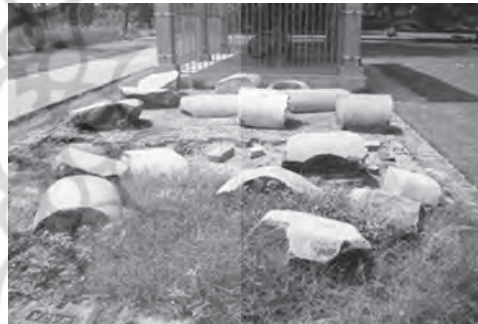
تصاویر ۱۴-۱۵-۱۶-۱۷) بقایای ستونهای تالار ستوندار مائوری در پاتالی پوترا - محوطه باستانی کومهرار در پاتنا، منبع: نگارنده، ۲۰۱۵ م.