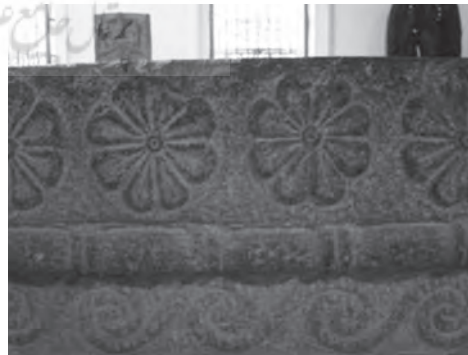
تصاویر شماره ۲۱-۲۲-۲۳-۲۴) پایه سرستون مائوری با نقوش گلدار و طرح کلی مشابه پایه سرستونهای هخامنشی، موزه مرکزی پاتنا