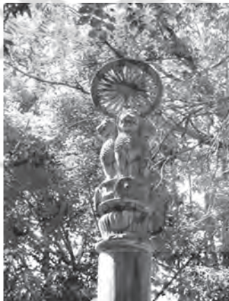
تصویر شماره ۲۰) ستون و سرستون آشوکا با نقش شیر در وات یو مونگ تایلند (Wat U Mong near Chiang Mai)

ستونهای موجود در سبک معماری هخامنشی معمولاً دارای یک پایه ستون بشکل نیلوفر واژگون (در تخت جمشید) یا پایه‌های مربع (در پاسارگاد) یا پایه‌های مدور در (شوش و همدان) هستند، در حالی که در ستونها و تالارهای ستون دار مائوری بطور کلی این عنصر حذف شده و ستونها بدون پایه ستون بطور مستقیم و همانند تنه درخت از زمین خارج شده‌اند.