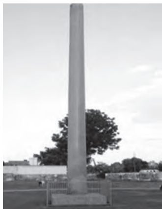
تصویر شماره ۹) سرستون لوریا (Lauriya_Nandangarh) از عصر آشوکا

این هنر مشترک و به عاریت گرفته شده از سوی هنرمندان و معماران هندی، پس از حفاری در پاتالی پوترا، پایتخت مائوریان، بخوبی مشاهده شد و پژوهشگران به بررسی و تحلیل این انتقال فرهنگی پرداختند. کلنل وادل و اسپونر را میتوان از پیشگامان مطالعه سبک معماری مبتنی بر تالارهای ستوندار هندی و تأثیرات هنر هخامنشی بر آن دانست. کلنل وادل پس از کشف سرستونهای آشوکا و بررسی این آثار، در اینباره مینویسد: «این سرستونها بطور کامل دارای سبک پرسپولسی هستند. هرچند برخی نشانه‌های هنر یونانی نیز در این ستونها دیده میشود اما این آثار به هیچ عنوان قابل مقایسه با نمونه‌های هنر هند و یونانی کشف شده در پنجاب نبوده و ستونها و سرستونهای کشف شده در کاخ آشوکا در پاتالی پوترا، قطعاً توسط هنرمندان پارسی و تحت فرمان مستقیم آشوکا ساخته شده‌اند» (Wadell, 1903).