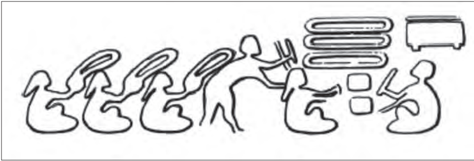
شکل ۱: گونهٔ صناعی (Roach 2009, fig 340).