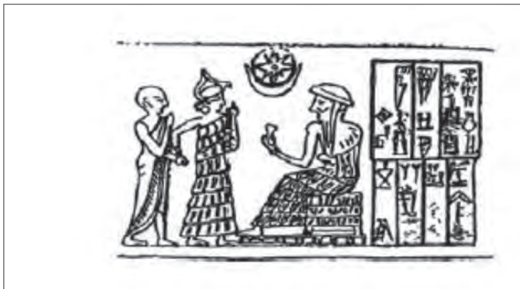
شکل ۴: گونه آیینی (Roach 2009, 2397).