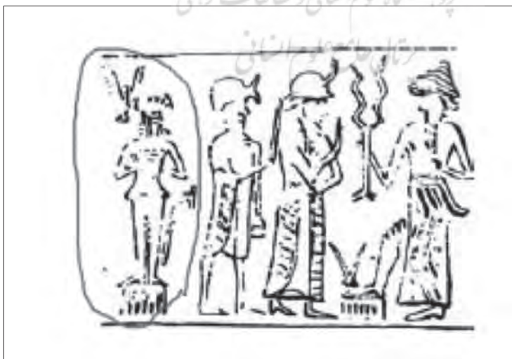
شکل ۶: گونه زنانه ب (تأکید از نگارندگان) (Roach 2009, fig 2639)