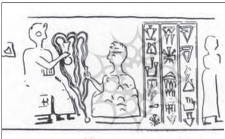
شکل ۵: گونه انشانی (Roach 2009, fig 3).