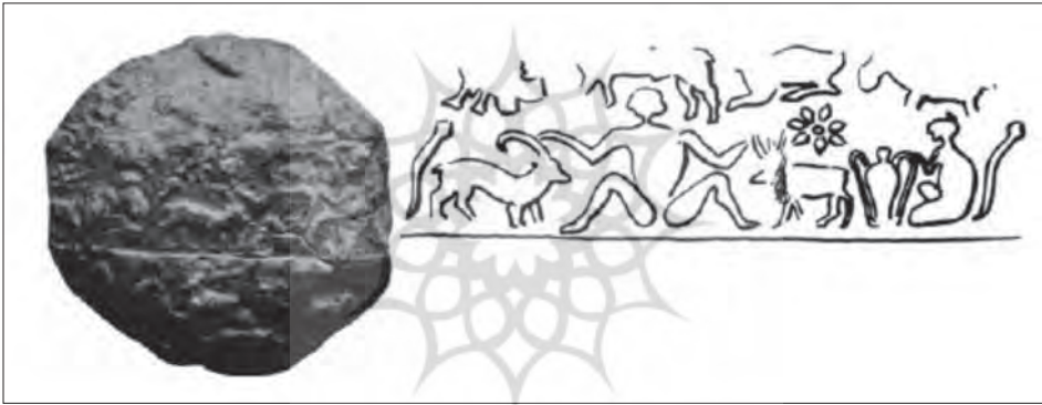
شکل ۲: گونهٔ زنانهٔ الف (Roach 2009, fig 293).