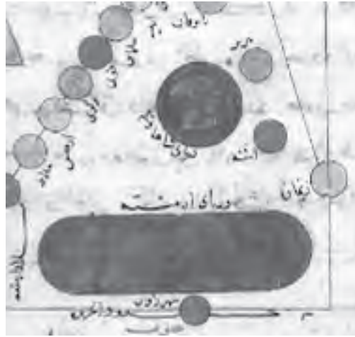
برش از ورق ۴۹ المسالک و الممالک، نسخه کتابخانه بریتانیا (IO Islamic, 1026)