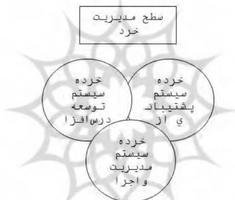
شکل ۱: مدل مدیریت آموزش از دور برای موسسات دوگانه هنجار یافته. چارلز کیترو اروین اسشوالا ۱ (۲۰۰۳).

با توجه به اینکه اهداف و خط مشی های آموزش از دور را دانشگاه پیام نور تدوین و ارائه کرده است، لذا لزوم دستیابی به این اهداف و اندازه گیری میزان موفقیت برنامه های آموزش از