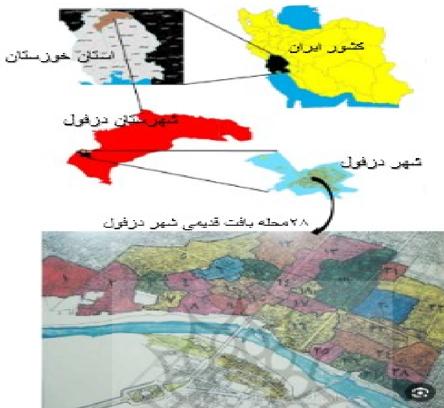
شکل ۱. موقعیت جغرافیایی، ۲۸ محله بافت قدیمی شهر دزفول