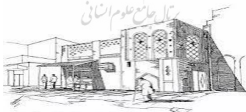
شکل ۴. کروکی از بافت قدیم دزفول

طراحی متناسب با اقلیم بافت قدیم دزفول نقش زیادی در شرایط آسایش محیطی دارد و این بافت را عین محیط کرده است (شکل ۴). این موضوع در بافت قدیم شهر دزفول با اقلیم خاص طراحی متناسب با محیط از اهمیت بیشتری برخوردار بوده است. در میان عوامل اقلیمی، دما نقش بسیار مهمی در شکل دهی به فرم این بافت شهرو جهت گیری خیابان، ارتفاع و تراکم ساختمان ها و ... داده است. در بافت های جدید شهر دزفول با وجود تجربه های غنی معماری قدیمی، طراحی متناسب با اقلیم به خوبی مورد کاوش قرار نگرفته است. فقط خلاقیت های طراحی اقلیمی متناسب با درجه حرارت و گرمای محیطی در بافت قدیم این شهرداری می شود.