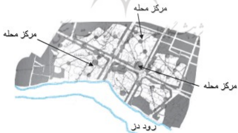
شکل ۲. موقعیت خیابان کشی های جدید در درون بافت و قرارگیری مراکز محله و شهر