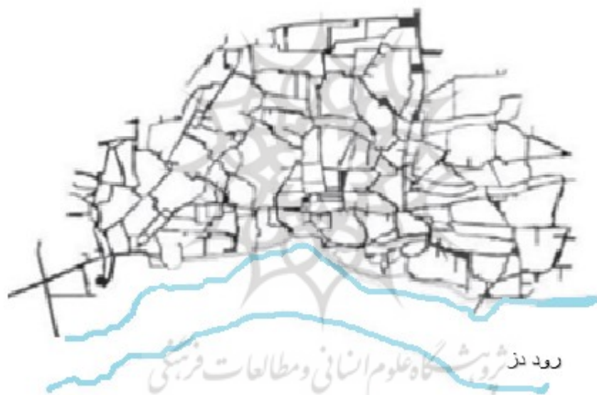
شکل ۳. نقشه شهر دزفول

بافت قدیمی شهر دزفول در ذات خود هماهنگ است، چون به صورت ارگانیک و در طول زمان شکل گرفته است. عناصر تشکیل دهنده آن هم پیوند هستند و یکدیگر را کامل می کنند. درست در مقابل ناهنجاری و ناهماهنگی که در فضاهای جدید این شهر می بینیم. علاوه بر این در بافت قدیمی دزفول عرصه های فضایی با مقیاس های مختلف وجود دارد. از عرصه خصوصی که خانه است تا عرصه نیمه خصوصی که درگاه است و عرصه عمومی یعنی گذر، گذر هم به چهارسوق و بازارچه و سرانجام به بازار منتهی می شود. بنابراین در سلسله مراتب ویژه ای؛ فضاهای ارزشمند با مقیاس و تعریفی مشخص شکل گرفته است. در حالی که در بافت جدید این شهر از منزل خارج می شوید یا با خیابان می گذارید، بعد از خیابان فرعی می رسید به خیابان اصلی و ناهماهنگی در ساخت شهر مشاهده می شود (شکل ۳).