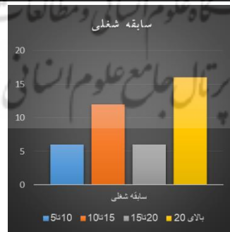
شکل ۳. فراوانی متغیر سابقه شغلی