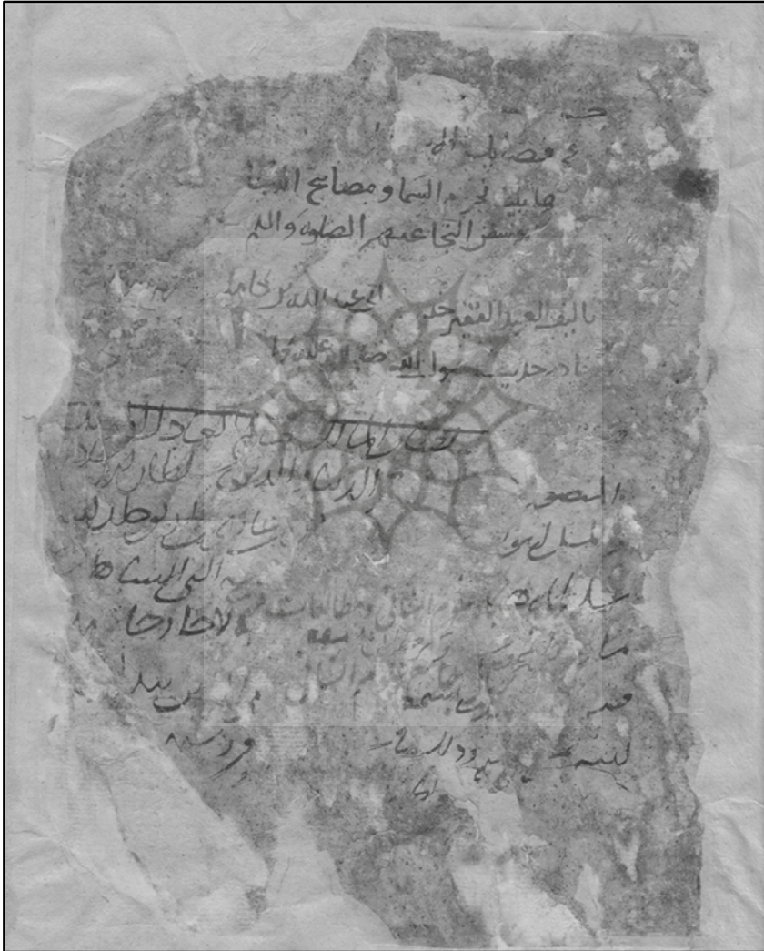
شکل ۵: تصویر روی برگ نخست از اصل نسخه پس از جداسازی برگ‌ها

پس از جداسازی دو برگ الصاقی، عباراتی جدید بر روی برگ نخست نسخه خطی مشاهده شد (شکل شماره ۵). بعد از عنوان نسخه، بخش مورد نظر ما، شامل نام مؤلف با این عبارت بود: تألیف العبد الفقیر خ ابی عبد الله بن کامل