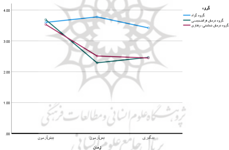
شکل ۱. نمودار مربوط به نمره افسردگی در گروه‌های پژوهش در سه مرحله اجرا

باتوجه به یافته‌های جدول ۴، در دو گروه پژوهش تفاوت معنی‌داری در میانگین نمرات افسردگی و اضطراب در مراحل پیش‌آزمون و پس‌آزمون و پیگیری وجود داشت ( P=۰/۰۰۱ ). نمودار تغییرات متغیرهای افسردگی و اضطراب به ترتیب در شکل ۱ و ۲ نشان داده شده است.